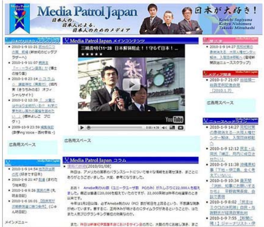
既に公開されているサイトのトップデザイン

一、間もなくスタートするメディア・パトロール・ジャパンは日本記者クラブで記者会見するが、皆さんにお願いしたいことがある。まず、過度な期待をするなどということ。次に情報をどれだけ多くの人に共有して貰えるかが勝負であり皆さんの協力が欠かせないこと。現在、一人で旗を立ててゲリラ戦を展開している人々に共に戦うための作戦を指導し、ネット言論のパワーをもっと高めたいと思っている。