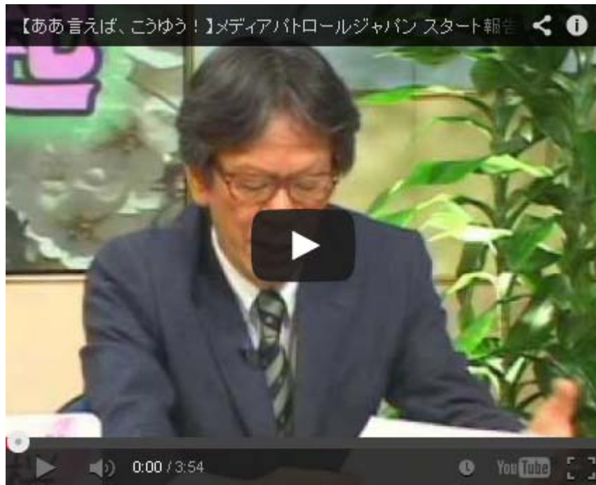
このチャンネル様の番組で新サイトの狙いがよく分かります

一、最近のメディアの偏向報道は「報道しない」という方向にエスカレートしている。外国人参政権に反対する大規模な集会やデモを一切報道しない。あるいは外国人参政権についての国会質問、昨年の稲田朋美議員、今年の高市早苗議員の質問シーンは国会中継されていない。これでは今なにか問題になっているのか、ネットをしない情報弱者には事実が伝わらない。