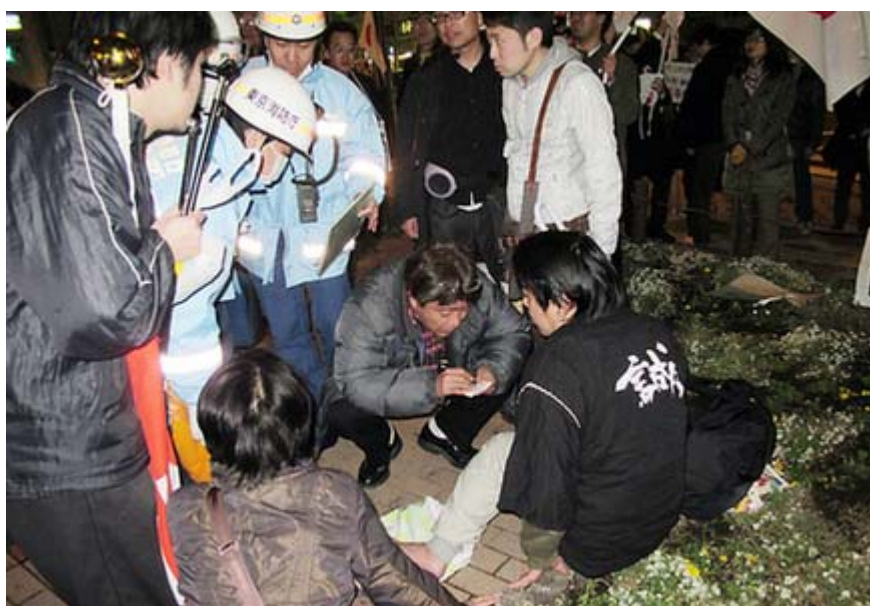
負傷者に事情を聞く担当官、このあと担架で病院に運ばれました

27日午後7時頃、都内の文京区民センター前で「『韓国併合』100年－3・1朝鮮独立運動91周年」2・27集会に抗議に訪れていた青年が、集会に参加した人間から暴行を受け、救急車で病院に運ばれるという事件が起きた。病院で治療を受けた結果「捻挫」と診断されたが、警備に当たっていた富坂警察の警察官が犯人を取り押さえなかったことから騒ぎが大きくなった。