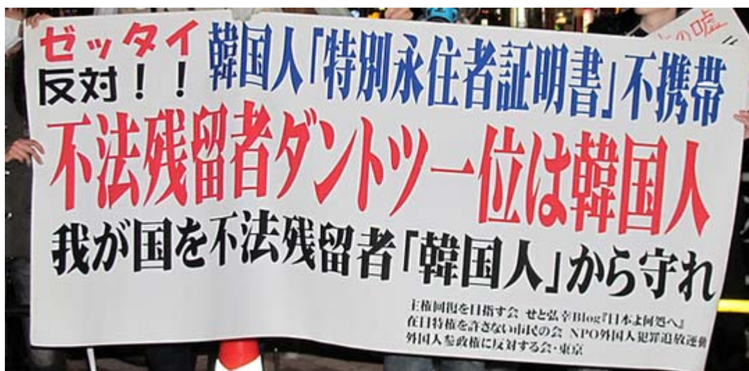
抗議団中央で目立った横断幕、この証明書不携帯も大問題です

このプログラムのうち、「在特会による朝鮮学校襲撃」というのは、京都の朝鮮学校が数十年にわたって市の公園を不法に使用してきた問題で、同会の関西支部が機材を撤去した件をさしている。ネット上にはこの動画がアップされ全国に知られているが朝鮮総連側が提訴しており、現在は係争中だ。