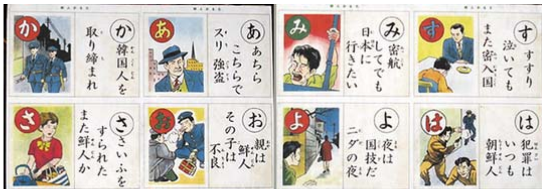
誰が考えてくれたのかこのカルタ風プラカードが面白いです

このプログラムのうち、「在特会による朝鮮学校襲撃」というのは、京都の朝鮮学校が数十年にわたって市の公園を不法に使用してきた問題で、同会の関西支部が機材を撤去した件をさしている。ネット上にはこの動画がアップされ全国に知られているが朝鮮総連側が提訴しており、現在は係争中だ。