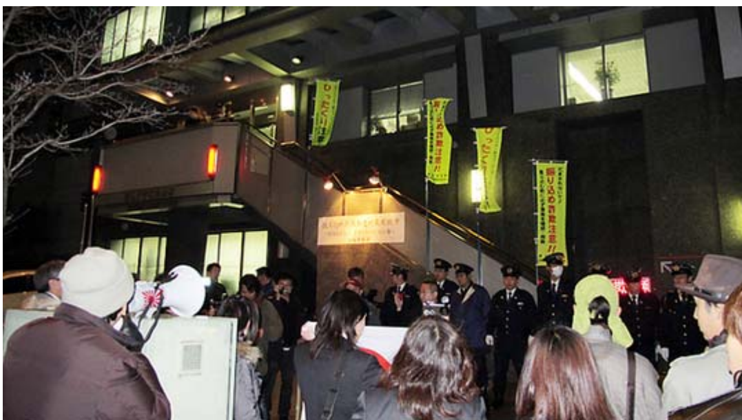
抗議団有志が富坂警察署に向向いて警備のやり方について抗議を行った

この日の抗議行動には小雨が降る寒い中、約80人が日章旗やプラカードを持参してシュプレヒコールを交えながら街頭宣伝活動を行った。機動隊のバスが5台以上、物々しい警備ぶりで、前述したように警備の矛先が一方向的に抗議団に対してであり、一時は「抗議活動中止命令？」が出されたとの情報も流されて参加者が「何だ、それ？」と首をひねる一幕もあった。