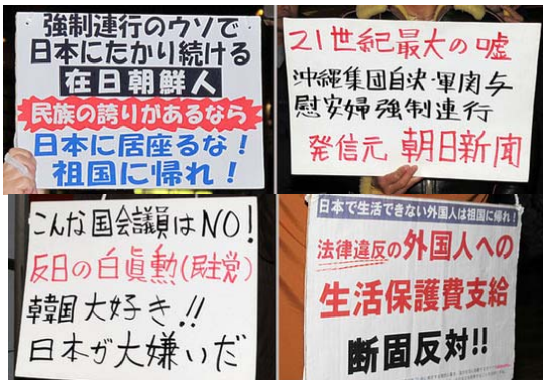
いろいろなプラカードのスナップ