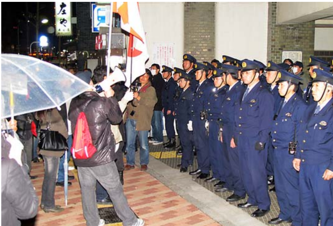
警備に当たる警察官の向きが違っているように思えるのですが？

この日の抗議行動には小雨が降る寒い中、約80人が日章旗やプラカードを持参してシュプレヒコールを交えながら街頭宣伝活動を行った。機動隊のバスが5台以上、物々しい警備ぶりで、前述したように警備の矛先が一方向的に抗議団に対してであり、一時は「抗議活動中止命令？」が出されたとの情報も流されて参加者が「何だ、それ？」と首をひねる一幕もあった。