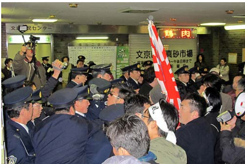
日章旗が投げ込まれたのを機にご覧のようなもみ合いになりました

主権回復を目指す会、せと弘幸Blog『日本よ何処へ』、NPO外国人犯罪追放運動、在日特権を許さない市民の会、外国人参政権に反対する会・東京など行動する保守五団体は27日、午後二時から渋谷で「環境テロリストを支援するオーストラリア政府を許すな」欧米白人の人種差別から日本の食文化を守るぞ！デモ行進を行ったあと、午後六時からこの抗議の街頭宣伝を行った。