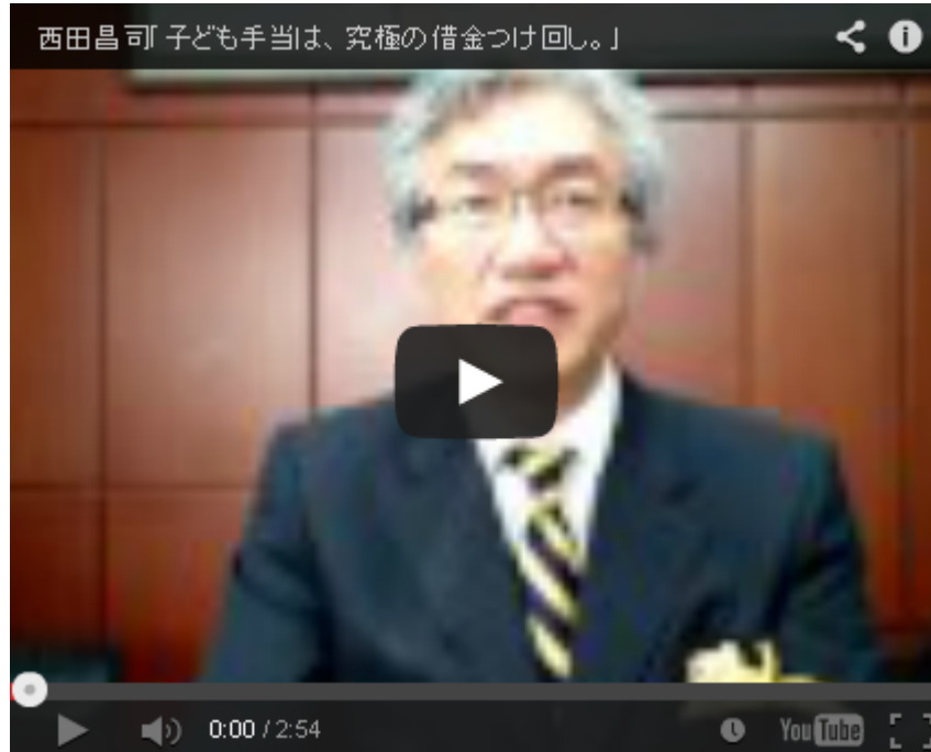
今や 自民党 の エース 級の働きをしている西田昌司議員、昨日の国会での追及も見事でした。

記事の最後、「 教育基本法 の精神を踏まえれば、海外在住の日本人子女に支援金を支給し、国内に住む外国人には一律不支給とするのが筋だ」という政府関係者のコメント、これが正論でしょう。これでは海外で頑張っている日本人が「私達はこれだけ頑張って祖国の為に働いているのに、日本は何も支援してくれないのか」と怒るのは当然だと思います。