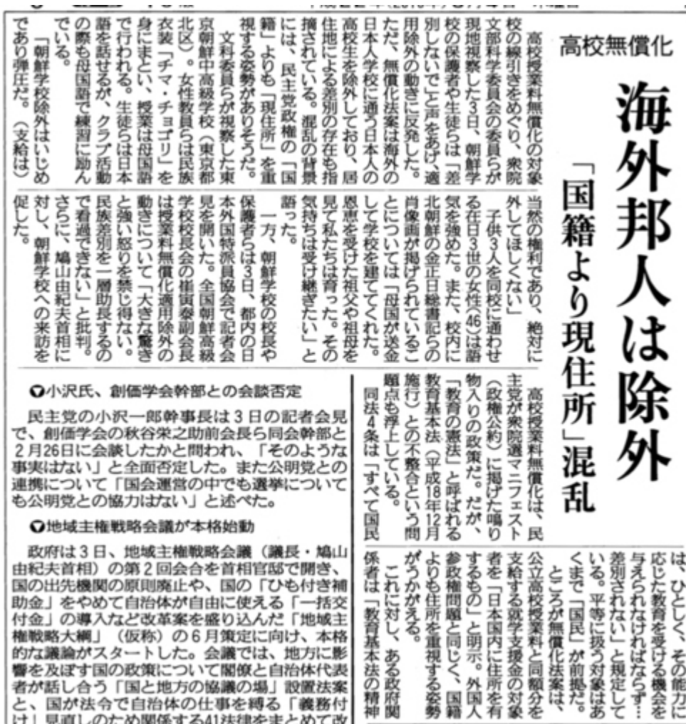
高校無償化で海外邦人は除外を伝えた産経新聞3月5日5面の記事 (画像クリックでネット記事にジャンプ)

高校授業料無償化の対象校の線引きをめぐり、衆院文部科学委員会の委員らが現地視察した3日、朝鮮学校の保護者や生徒らは「差別しないで」と声をあげ、適用除外の動きに反発した。ただ、無償化法案は海外の日本人学校に通う日本人の高校生を除外しており、居住地による差別の存在も指摘される。混乱の背景には、民主党政権の「国籍」よりも「現住所」を重視する姿勢がありそうだ(中略)。