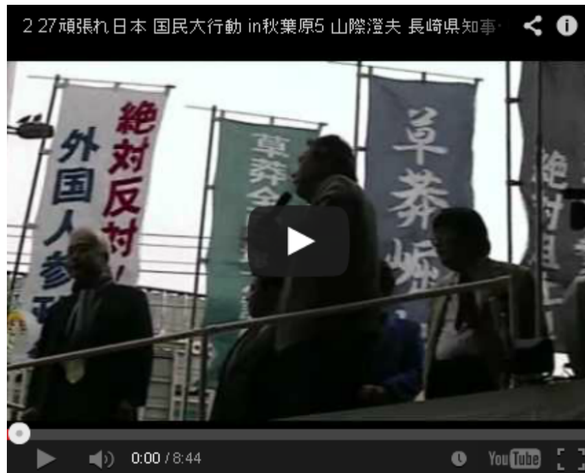
2月27日、 秋葉原デモ にも参加、街宣車に乗って挨拶

民主党政権 がやっていることは、日本を一見、平等だが貧しい社会にすること、つまり「みんなで貧しくなろう」という旧ソ連や旧東欧、 中国 、 北朝鮮 、 キューバ など全体主義国家でやって破綻した社会主義政策の再現なのである。