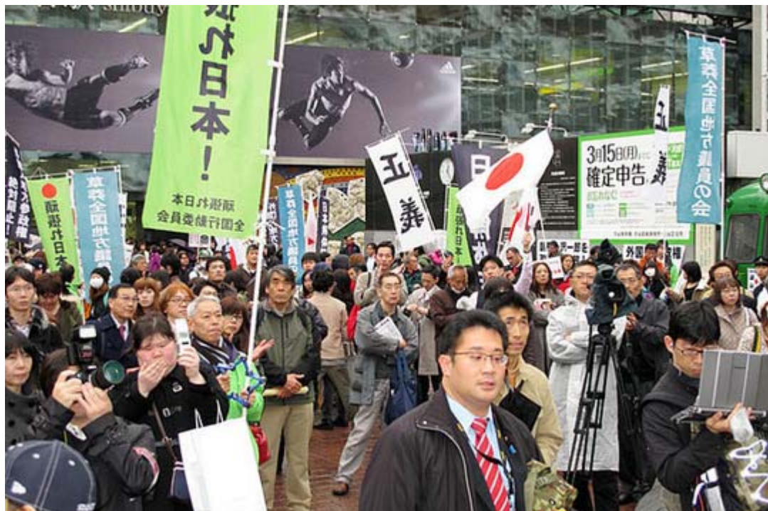
渋谷で街頭宣伝を聞く方々。この時は雨は上がっていましたが。

今回も全く同じ時刻に日本を護る会主催による創価学会撲滅デモが新宿で実施されており、同じ保守系団体の抗議行動がぶつかっていることも、参加者が分散した要因かも知れません。「正しい歴史認識、国益重視の外交、核武装の実現」さんが既にレポートをアップしてくれていますので是非ご覧ください。