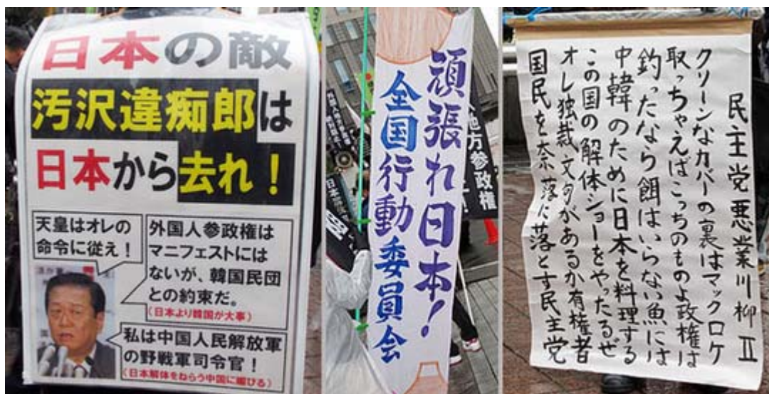
どんどん新しいバージョンが登場する参加者手作りのプラカード

報道される情勢では、外国人参政権では閣法提出困難、変わって選択的夫婦別姓が急浮上という構図だ。 横浜 はこの法案の熱心な推進者である千葉景子法相が改選期を迎えており、これに対抗するため藤井厳喜氏が出馬を決断しているだけに気合いの入った街宣が行われた(ニュース調こまで)。