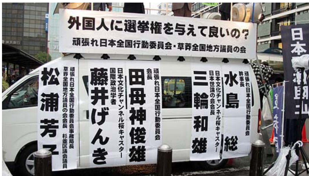
街宣車のスペースを隅から隅まで利用しているという印象です。

主催したのは頑張れ日本！全国行動委員会、草莽全国地方議員の会、外国人地方参政権絶対阻止行動委員会、日本文化チャンネル桜二千人委員会有志の会ほか。この日は渋谷で正午から、横浜でも午後一時から街宣行動をスタート、渋谷組が一時間で切り上げて横浜に合流するというスタイルを取った。