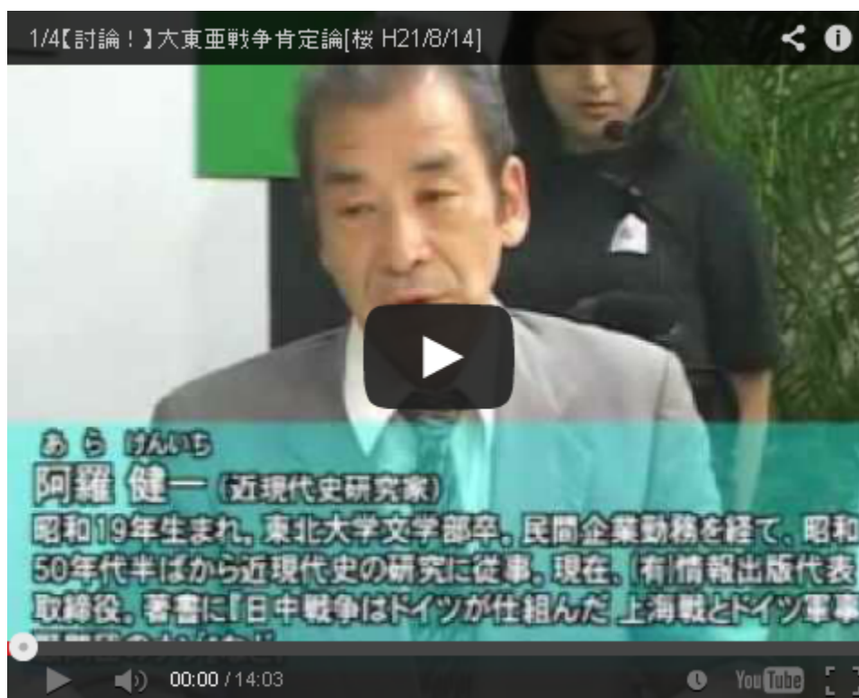
この討論番組は昨年の主戦記念日特集として放映されました

そのアメリカが今の大統領、肌の色ある大統領を選ばざるをえないという現実を知ってください。こうした歴史の現実をみんな無視している。誰だって戦うのはイヤですよ。昭和16年当時、この国は立憲君主国と言ってきたでしょ。立憲ですよ、ですから法治国家なんです。