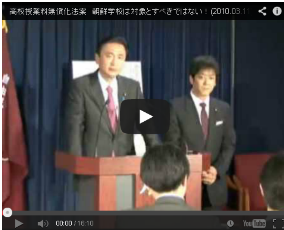
昨日の自民党本部での記者会見のビデオです