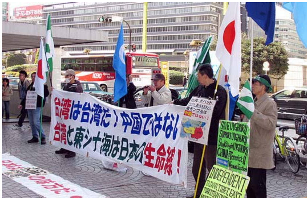
台湾は日本の生命線だと道行く人に訴えた

2005年3月14日、支那中共はこの日、台湾侵略を合法化する「反国家分裂法」を制定するという暴挙に出た。この国の侵略体質を現したのとして当時国際社会から非難を浴びたことは記憶に新しいが、この横暴な立法措置に対して、台湾の李登輝元総統が「3月14日」を記念日にすることを提案、当時の民進党政権がこれを受け入れ、2006年にこの日を「反侵略記念日」と定めた。