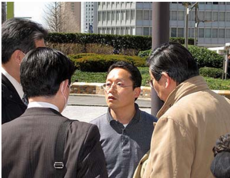
暴力をふるった外国人、背中男性はいつもの公安警察の方々。

に反対する国民集会」の主催者に賛同して署名活動を行っている青年団体で、当時は五人前後の若者がマイクで訴えながら署名活動を行っていた。