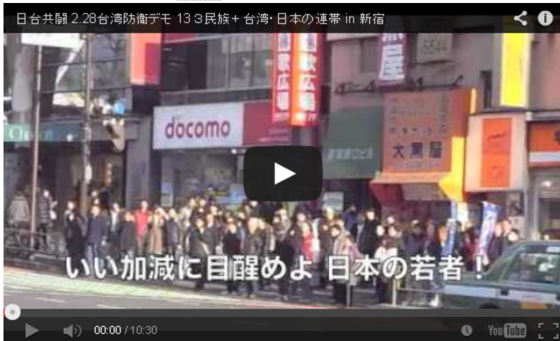
2月28日には台湾防衛デモも新宿周辺で盛大に行われた

この街頭宣伝活動には「台湾は台湾だ！中国ではない」「台湾と東シナ海は日本の生命線！」と書かれた大きな横断幕のほか、路上には「日本はチベット・ウイグル・南モンゴル・台湾の味方だ」と反中国で結束するアピール文が貼られ、道行く人にビラ配布とともに訴えていた。主催したのは日台関係正常化を目指す会、台湾研究フォーラム、メルマガ台湾の声、日本ウイグル協会、ウイグル問題を考える会、南モンゴル応援クリルタイの六団体。