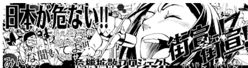
画像クリックでケシクズさんへ 動画版「街宣! 街宣! (修正版)」

麻生降ろしの時にも感じたことですが、貴方は自分の信念の行動が、実は 自民党 に大きなダメージを与えていることについて、どう思っているのでしょうか？。今回も、 民主党 の不祥事続出で支持率が急落し、地方選は十連敗という絶体絶命のピンチになっているのに、貴方の行動で 民主党 はかなり救われました。少なくとも、地方では 自民党 の地方組織の頑張りでこれだけ押し返してきたのですよ。