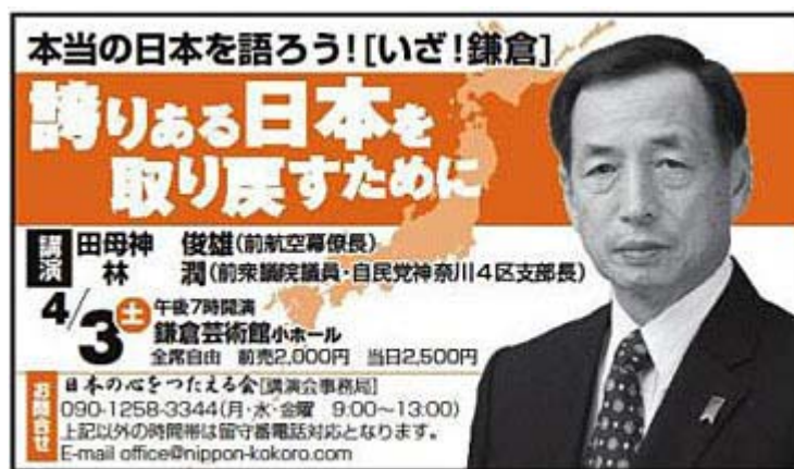
画像クリックで告知サイトに飛びます