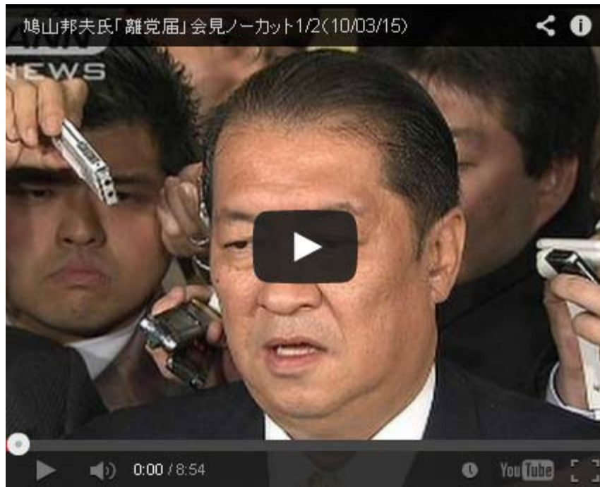
昨夜の記者会見のノーカット版の動画、その2もあります

それと私も年を取った(因みにあなた様と同じ年ですが)せいか物忘れが進んだのかも知れませんが、私ははっきり「外国人参政権」については貴方は容認派だと思っていました。 人権擁護法案 のときも外国人参政権のときも、国憂う保守系日本人が必死で反対運動をしているとき、いつも中川昭一氏や安倍晋三氏、平沼赳夫氏や西村慎吾氏の姿はみえるのに、貴方の姿を見た記憶がありませんよ。大きな抗議集会や大会にはほとんど出席してきたのですが？。