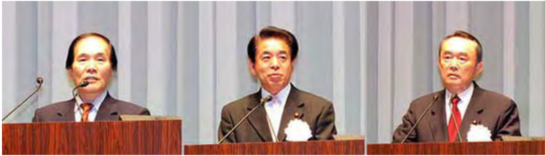
左から民主党の吉田公一議員、自民党の下村博文議員、 国益と国民の生活を守る会の平沼赳夫会長

これからの運動方針として①引き続き500万の目標達成のため署名活動を継続する、②全国会議員の過半数の国会議員の反対署名を目指す、③この選択的夫婦別姓法案を政府が提出を断念するまで活動を続ける一などを確認して大会を終えた。