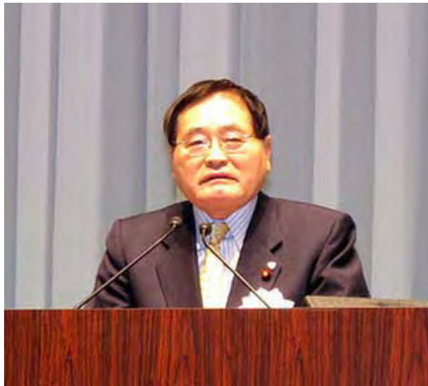
いや～ 国民新党 さんには足を向けて寝られないですね

一、日本は昨年から殺人事件の半分以上が親子、兄弟、夫婦の殺し合いになりました。事件が起きると被害者の身内を捜査すれば半分以上が犯人です。皆さん、日本はこんな国でしたか？世界にこんな国はどこにもありませんよ。