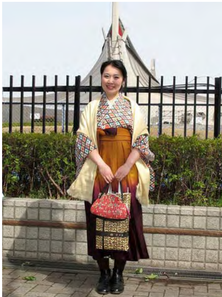
卒業式の袴・きもの姿で参加された一般の女性。きものお母さんのものを大事に着ているそうで袴は自分で用意したと言います。これぞ大和撫子でしょう。

女性グループであるそよ風のデモは、前回はきもの姿の女性が目立ち、好印象を与えていますが、今回はちょうど卒業式シーンにもあたり、何と袴姿の女性を見つけましたので、撮影と掲載許可を頂きました。やはり左翼と違って、日本が大好きという女性は素敵の方が多いですね。