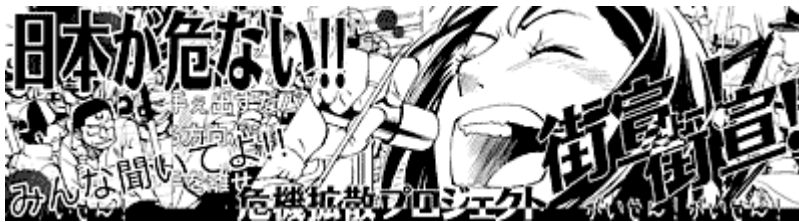
画像クリックでケシクズさんへ 動画版「街宣！街宣！（修正版）」