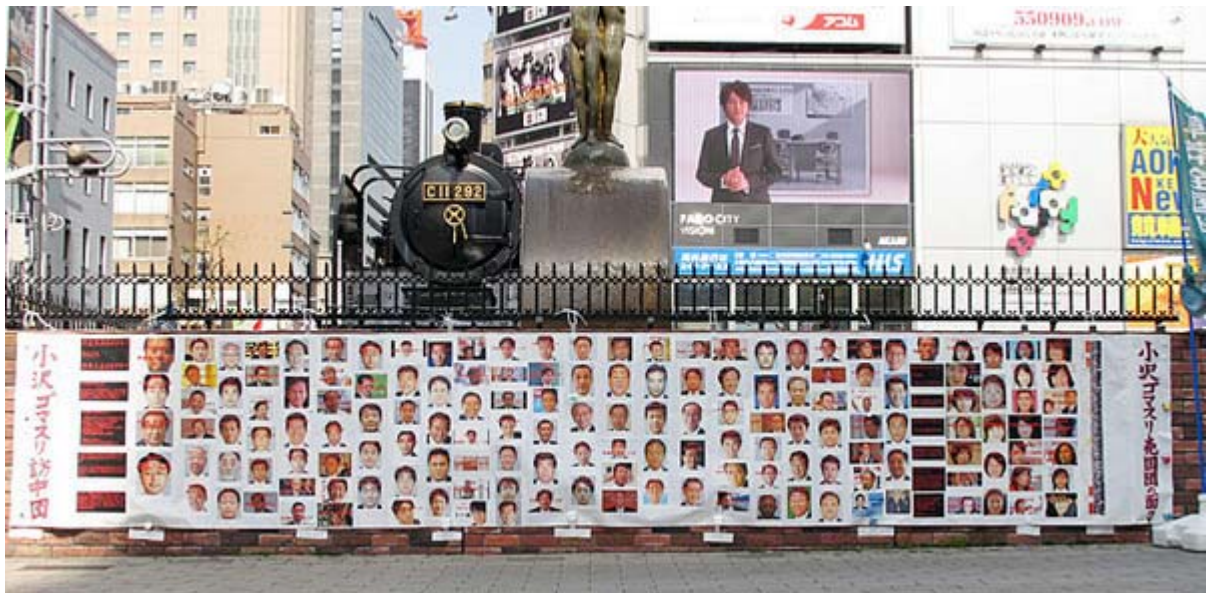
後ろの機関車と比較するとこの特大パネルの大きさが理解出来ると思います。