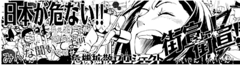
画像クリックでケシクズさんへ 動画版「街宣! 街宣! (修正版)」

詳しくは同会のブログで紹介されていますが、一人一万円で賛同者の名前を掲載するとあります。以前、チャンネル桜が行った「NHK解体」の広告イメージだと思いますが、こちらの方もご協力をよろしくお願いします。