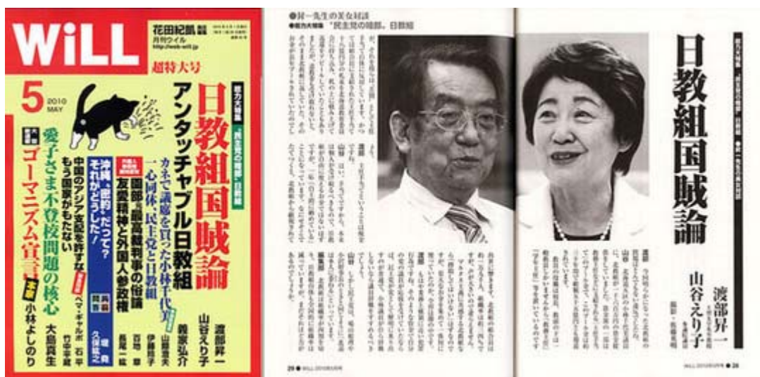
WILL5月号は税込み780円で好評発売中です(画像クリックでHPIにジャンプ)

先日も伊藤玲子さんとビックサイトの帰りに電車でご一緒させて頂き、お話しを伺ったのですが、ご高齢にもかかわらず日教組粉砕に並々ならぬ執念を訴えておりました。以下、渡部昇一VS 山谷えり子 両氏の16ページに及ぶ対談「日教組国賊論」から、その一部を抜粋して紹介致します。本号も読み応えがあります。