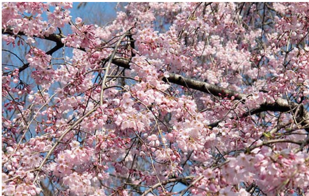
東京駒込・六義園のしだれ桜(七部咲き)3月27日10時10分頃撮影