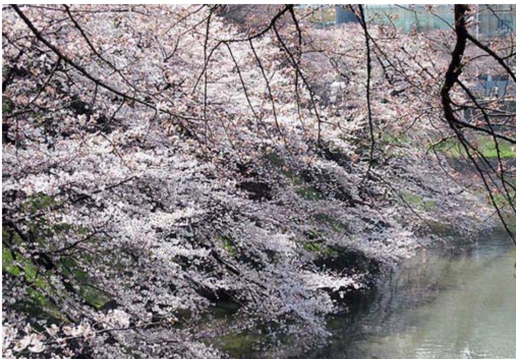
千鳥ヶ淵のお堀端の桜、まだまだこれからです(3月29日正午頃撮影)

・参議院選挙神奈川選挙区は定数6で、現在は民主党が4、自民党が1、公明党が1という勢力図。民主の強い地域だ。このうち7月に改選を迎えるのは3人、民主党の千葉景子、同じく金子洋一、自民党の小泉昭男だ。金子洋一は浅尾慶一郎の衆議院への鞍替えで昨年秋の補選で当選したばかりだ。