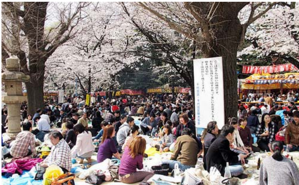
桜の下での宴会、お馴染みの光景ですね。皆さん、一緒に聞いて歌っていました。