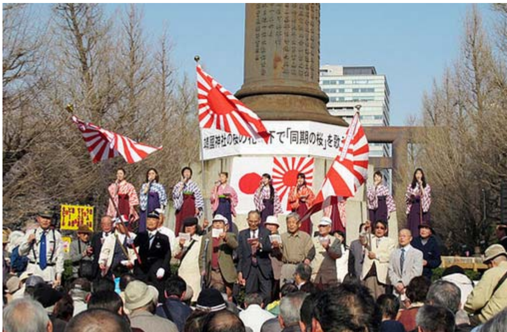
桜の花の下で「同期の桜」を歌う会のスナップです。

しかし、皆さん嬉しそうに合唱してますね。私は恥ずかしながら6-7曲くらいしか歌えませんでした。知っている方は歌集も見ないでそらんじて歌っていました。途中で気がついてまわりを見渡してみると、後ろの方まで参加者の列が伸びており、境内の左右も含めると8月15日の中央式典と変わらないほどの人(約二千人)が参加していました。