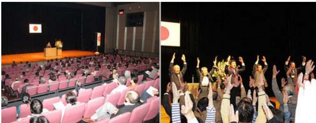
講演会場の鎌倉芸術館小ホールとメの万歳三唱

日本の心を伝える会主催によるはじめての講演会「本当の日本を語ろう！いざ鎌倉・誇りある日本を取り戻すためには」が三日、午後七時から鎌倉芸術館小ホールで開催されました。良い講演会でしたね、日心会の皆さん、本当にご苦労さまでした。普通の講演会で国歌斉唱ではじまり、万歳三唱で締める会はめったにないでしょう。