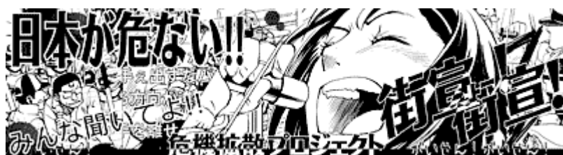
動画版「街宣! 街宣! (修正版)」