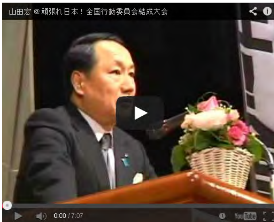
2月2日の「頑張れ日本！全国行動委員会」での挨拶の動画です。良かったと思います。

新党の理念・政策は「依存から自立へ」を基本原理とし、(1)経済の自立(財政再建、地方分権、税制改革)(2)地方の自立(都市だけでなく豊かな地方、歴史と伝統の尊重)(3)国家の自立(真の外交国家への転換)ーを掲げた。(後略)