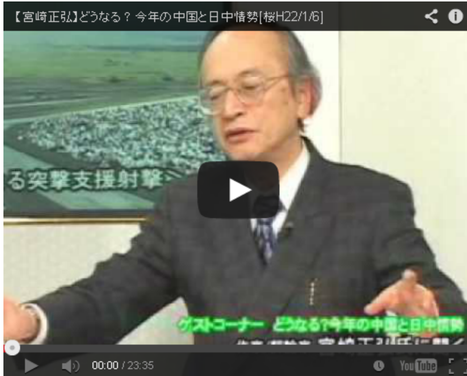
チャイナウオッチャーとして第一人者の定評がある宮崎氏。