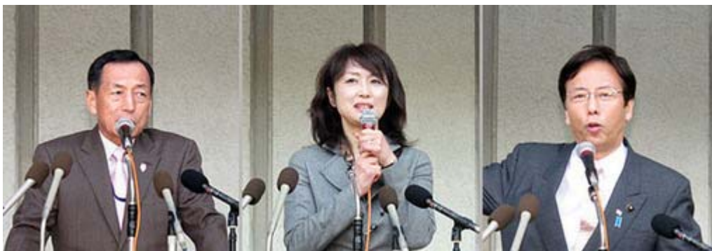
田母神俊雄、中川郁子、土屋たかゆきの各氏