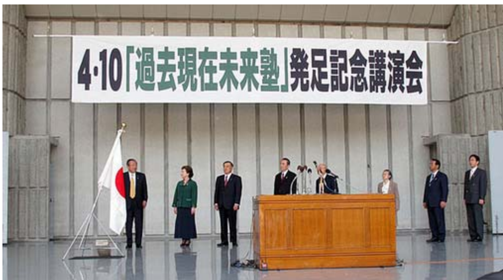
最初の「国歌斉唱」のために登壇された来賓の方々です ( ハブニング で天皇陛下万歳もありました)

講演会は午後二時から始まって終わったのは午後七時近く。最後には会場からの質問も受けて講師陣がこれに応える時間も設けられた。今後「過去現在未来塾」は、日本の危機的状況を広く国民に伝える啓蒙活動を全国的に実施するという。(ニュース調こまで)