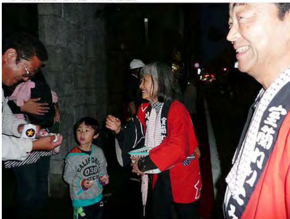
告発の対象となったショット。