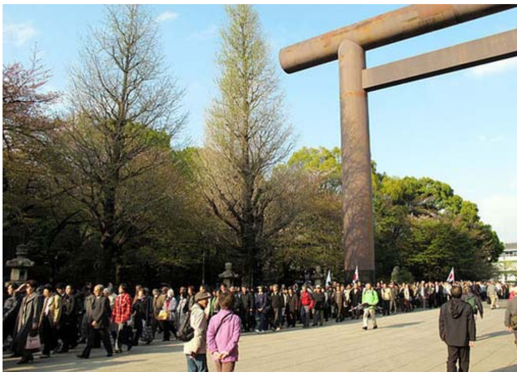
武道館の一万人大会を終えて靖國参拝に集まったのは600人を超えました、壮観でした。

デモ参加者のほとんど全員が武道館の「外国人参政権に反対する一万人大会」に出席、 日本会議 を応援する形となりました。終了後は靖國神社の大鳥居前に集合ということで出かけてみると、なんとデモ参加参加者より多い、600人強が集まっていた。