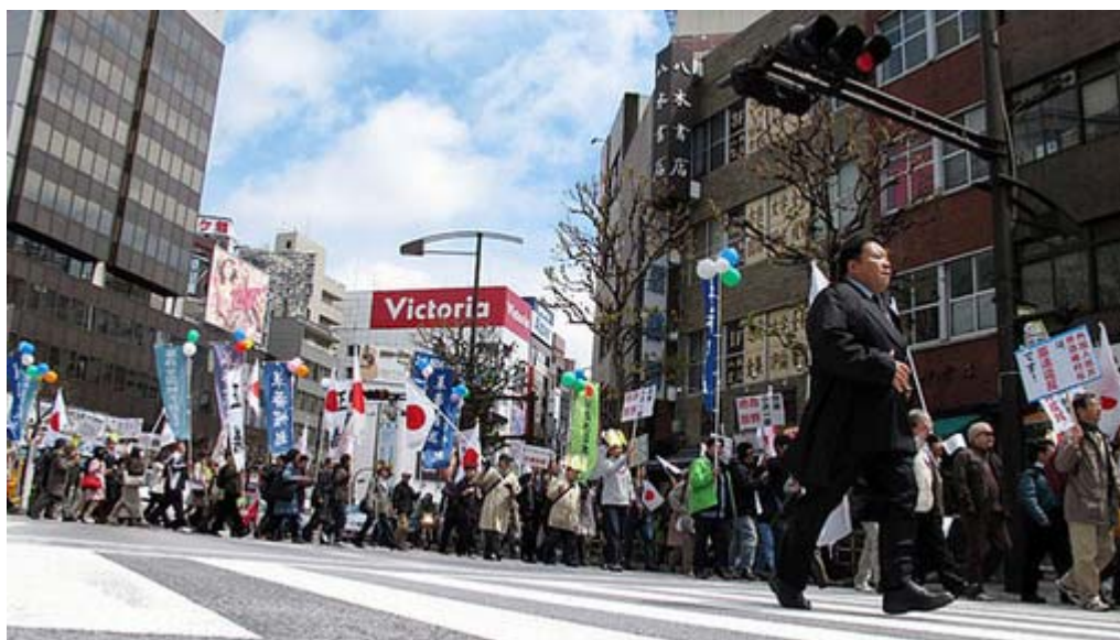
たまには、と思って地べたに這いつくばって撮影した画像です。

デモ行進には新しい趣向が取り入れられました。今回、事前のPRの際に「集まれ日の丸サポーター」と題して若者だけのデモ隊を作る旨の動画を配信(あの女性可愛かったですね)、500人を超す隊列(主催者発表は千人)の先頭でスタートしたのです。途中で KAN のヒット曲「愛は勝つ」を皆で合唱するなど、これまでとはひと味違う若さ溢れるデモ行進となりました。