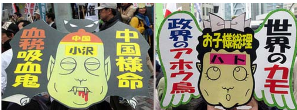
今回からデビューした全国行動委員会の秘密兵器。 必死の手作りで150枚を用意したという傑作。

4月17日(土)に盛大に実施された「外国人参政権に反対する一万人大会」にあわせて、頑張れ日本！全国行動委員会は午前中にお茶の水駅前で街頭宣伝、午後からデモ行進を行い、武道館に出席したあとに靖國神社に参拝しましたが、そのスナップ集をお届け致します。