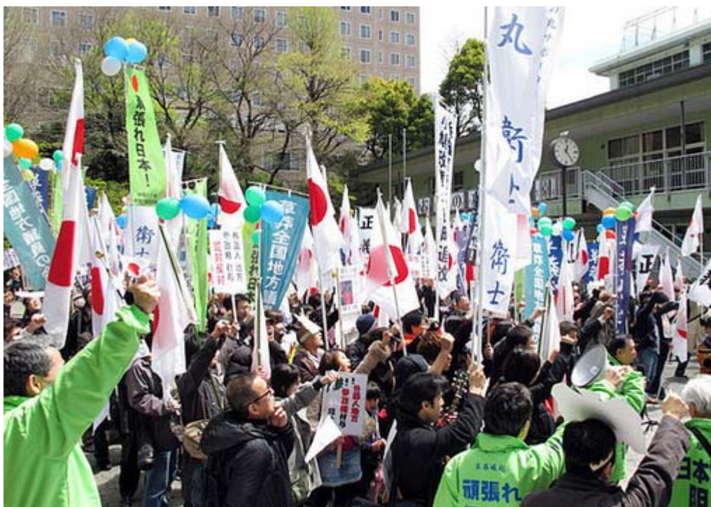
お茶の水・錦華公園でデモ行進出発前に気合いを入れるシュプレヒコール！