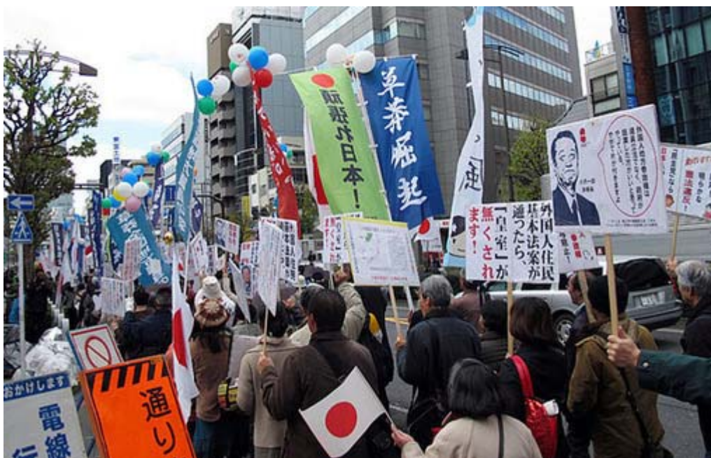
靖国通りを500人超のデモ隊が日の丸、幟、プラカードを林立させて力強く行進しました。