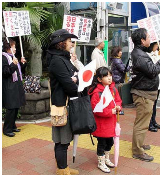
いや～可愛いですね、 お嬢ちゃんに日の丸がよく似合います。