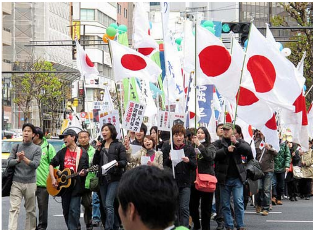
今回はじめての試み、若者だけの「日の丸サポーター」がデモ隊の先頭にたちました。 KAN の「愛は勝つ」を歌っているシーンです。

デモ行進には新しい趣向が取り入れられました。今回、事前のPRの際に「集まれ日の丸サポーター」と題して若者だけのデモ隊を作る旨の動画を配信(あの女性可愛かったですね)、500人を超す隊列(主催者発表は千人)の先頭でスタートしたのです。途中で KAN のヒット曲「愛は勝つ」を皆で合唱するなど、これまでとはひと味違う若さ溢れるデモ行進となりました。