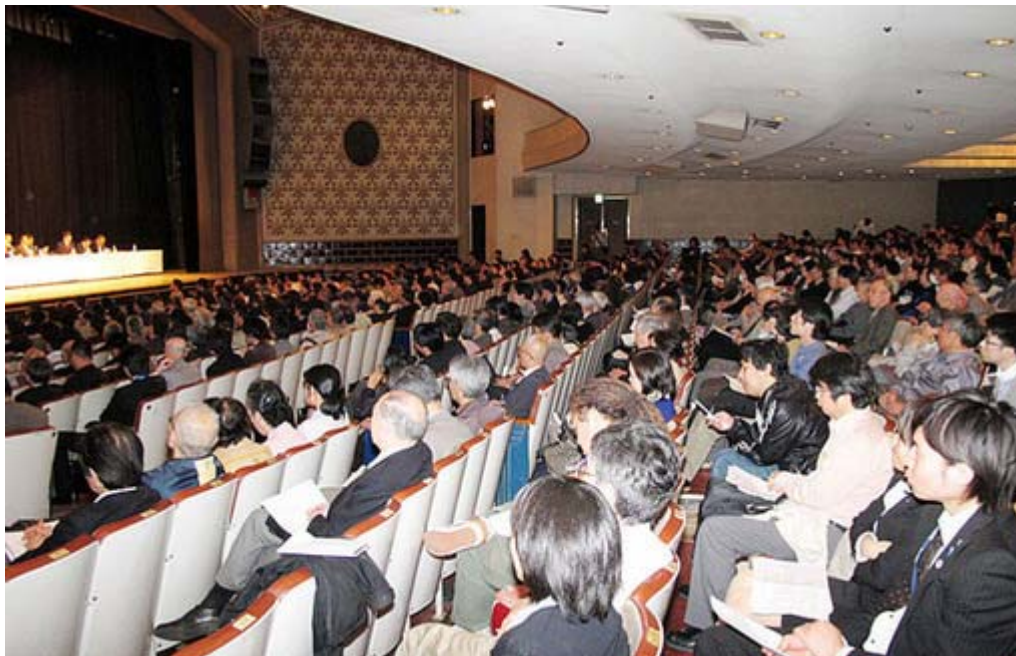
日比谷公会堂は主催者発表で1500人が参加、熱心に スピーチ ・ 訴え を聞いていた

今後の運動方針として、従来の署名活動のほかに、 ブルーリボン の着用のさらなる普及を国会議員に対して働きかけるほか、五月か六月には一般にアピールするためにデモ行進や国会前での座り込みなども計画、政府と国民に強くアピールすることを検討しているそうです。以下、同会がピラでアピールした内容と、大会の進行表、そして大会決議を掲載しました。