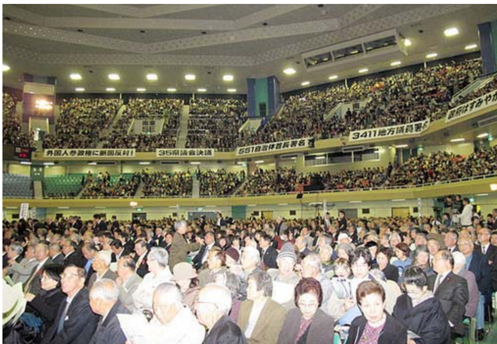
いや～本当によく集まりました。保守の政治系でこれだけ武道館を埋めたのは久しぶりでしょう。

みんなの党は外国人参政権法案に反対を致します。日本は開かれた国です。外国生まれの人でも、日本国籍を取得すれば国会議員にも総理大臣にもなれる国なんです。こんな開かれた国で、なぜ地方参政権を外国人に与えよ、などという法案が出て来るんでしょうか。