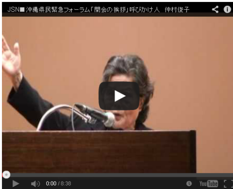
感動的なスピーチ、スタンディング・オベーションで拍手喝采ものです。