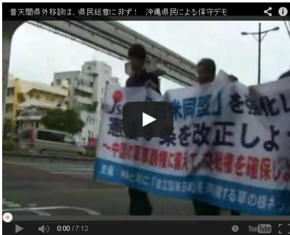
4.4デモの動画。反日マスゴミが報じない沖縄の真実です。

私が現役の時に見ました。ポスターを貼られていました。そのポスターの前を通る時は、絶対こんなになってたまるか、私は握り拳を握りしめて歩きました。それはどんなポスターだったかと言いますと、「沖縄を日本革命の拠点にしよう」こんなものだった。これは今から数えると43年前です。私の記憶では。そういうポスターが貼られていたのは43年前です。