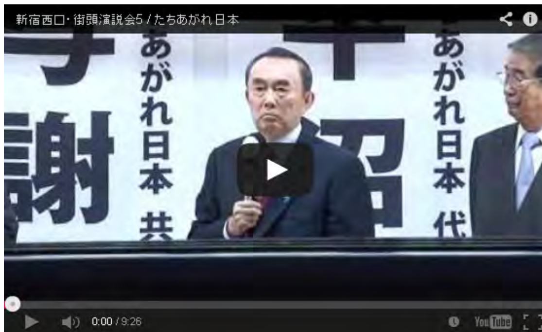
注目！【平沼赳夫】「たちあがれ日本」結党の本意[桜H22/4/29]

日露戦争日本海海戦で旗艦三笠に掲げられたZ旗は「皇国の興廃此の一戦に在り、各員一層奮励努力せよ」の意味を込めたものですが、私が街宣やデモでZ旗を掲げているのも全く同じ意図からです。最近では普通サイズのZ旗では機動性に欠けると、東郷神社で求めた小さなZ旗を鞆にいれるスタイルに改めています。