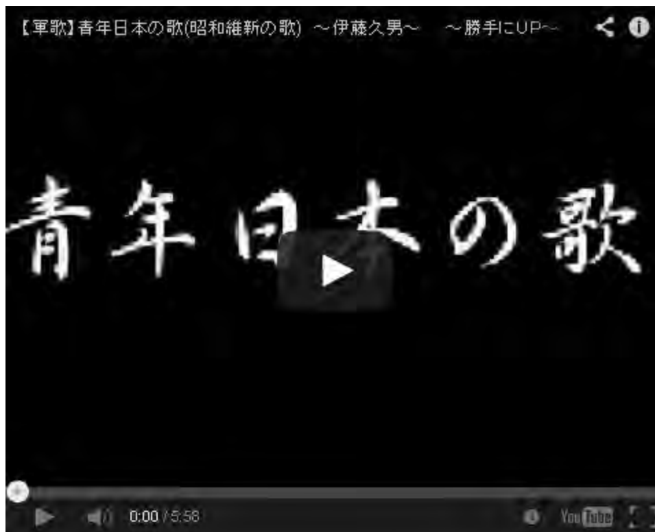
昭和維新の歌 1930年. 作詞・作曲：三上卓 歌：伊藤久男