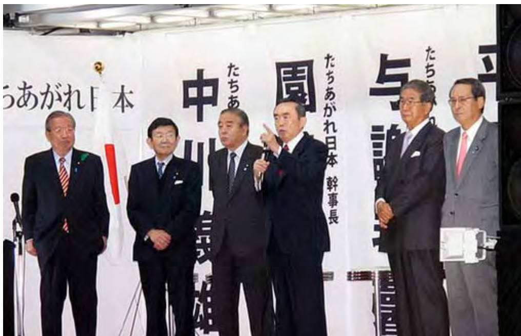
五人の結党メンバーと応援団長が勢揃いした新宿街宣、日章旗が見えるでしょうか。

この日のために準備した街宣カーには平沼赳夫、与謝野馨、藤井孝男、園田博之、中川義雄の五人の議員と応援団長の石原慎太郎東京都知事が勢揃い。周辺を埋めた多くの人々を前に限られた時間の中でそれぞれ簡潔に主張をアピールしていた。