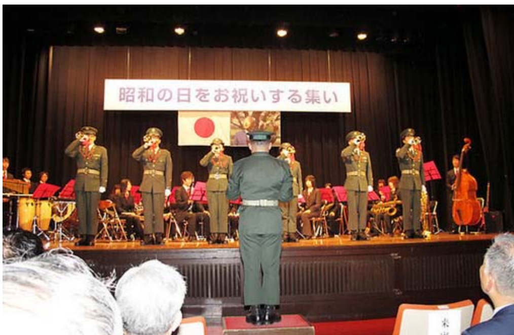
目の覚めるようなラッパを聞かせてくれた自衛隊ラッパ手

もし、編集無しノーカット版の動画がアップされたら必見です。また第三部の演奏会も自衛隊ラッパ手が目の覚めるようなラッパを聞かせてくれました。拓大吹奏楽部の演奏も、最後は「海ゆかば」を演奏してくれましたが、できればこういう生の演奏で君が代とか海ゆかばを大勢で歌ってみたいと思いました。