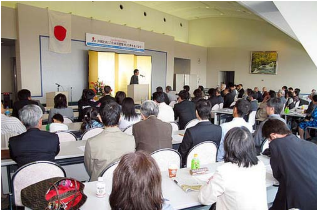
日米同盟危機緊急対策集会在開かれた文京シビックスカイホール

集会は、今後の活動方針として、沖縄の実情を知ってもらうためのいろいろな処に向いて説明する、石垣島ほか与那国島などで中国の進出に対する反対決議を採択する運動を進める、などと語っていた。集会のあと沖縄から上京したメンバーと参加した人との懇親会が開かれた(ニュース調こまで)。