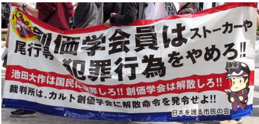
カルト信者のしつこいストーカー行為を糾弾する横断幕。 最近はかなり減っていきなり仮処分等々の法廷戦術とか？。

それにしても、行動する保守の活動についてはこれを批判する勢力が同じ保守にも多い中で、着々と勢力を拡大、大手メディアが報道しない在日や創価学会などのタブーにも果敢に切り込み、大きな成果を上げています。