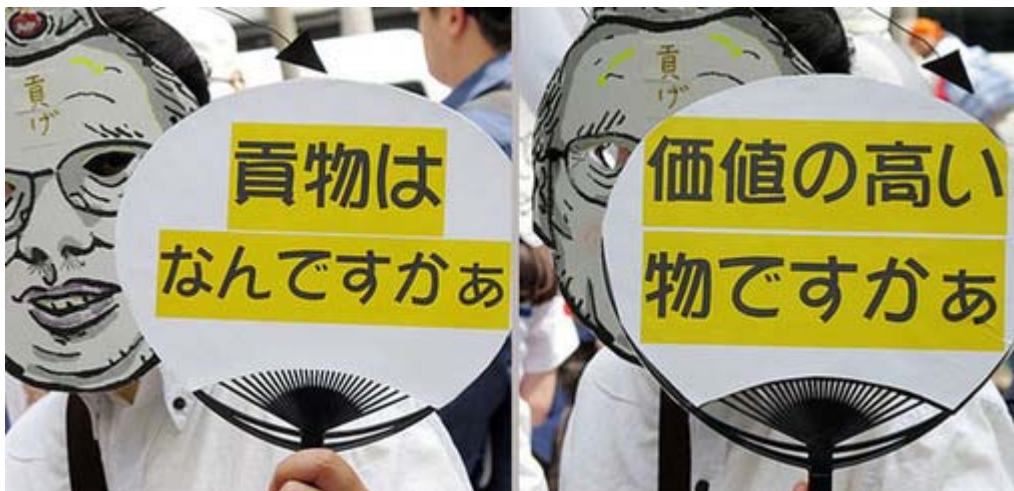
なにか「いかにもカルト？」を連想させる内輪とお面ですね。

それにしても、行動する保守の活動についてはこれを批判する勢力が同じ保守にも多い中で、着々と勢力を拡大、大手メディアが報道しない在日や創価学会などのタブーにも果敢に切り込み、大きな成果を上げています。