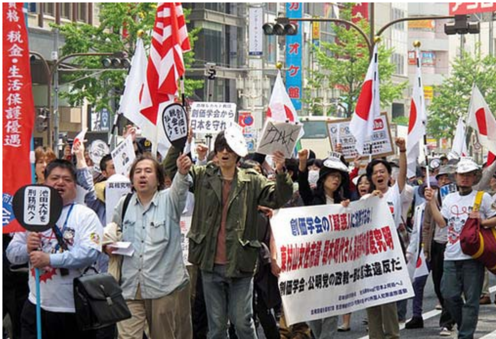
シュプレヒコールを叫んでいるカット。最近では女性陣も積極的です。

今年の参院選、小さな新党が乱立して票が分散し、 民主党 単独又は民公連立となるのが最悪のシナリオである。そのシナリオは現実のものとなる可能性がある。