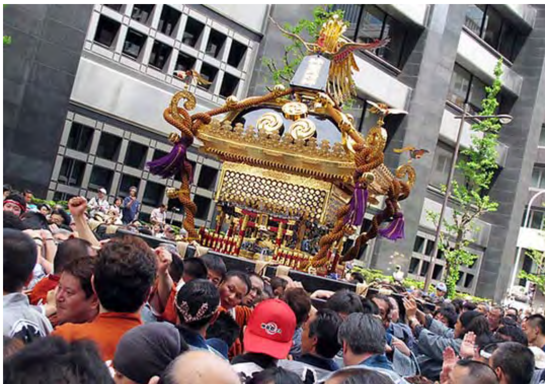
間近で見ると本当に大きくて迫力があります、神田明神の大神輿。

それでも今年は平将門が神田明神に祀られてから700年目の記念年にあたるため、「神田明神の大神輿」と、通常は大手町の将門塚から出る「将門塚保存会大神輿」が、神田明神から揃って宮出しされ、大きな話題を集めました。これははじめてのことです。