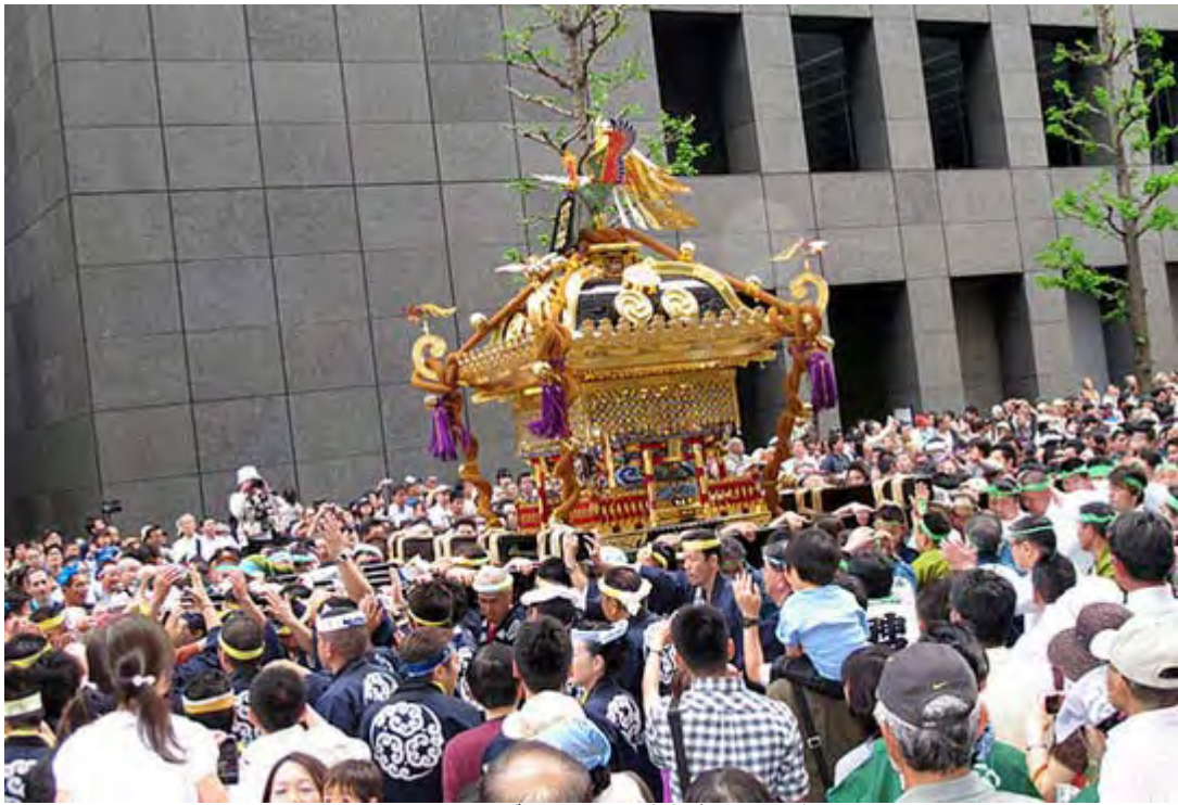
ちょっと引いたアングルから。人の多さが判るでしょうか？

それにしても大手町のビル街でも神田明神の大神輿は本当に迫力ありますね。みると、とにかくアマチュアカメラマンの数の多さに驚きますが、年配の男性や女性が本格的な一眼レフのデジタル・カメラに望遠ズームレンズをつけて撮影する姿が目立ちました。