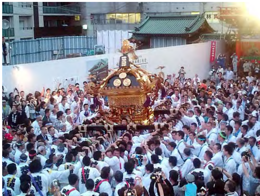
神田明神境内に戻ってきた大神輿、場内の興奮も最高潮になります。

私の小さい頃はお祭りで山車を引いて終わってから貰えるお菓子類が本当に楽しみでした。しかも自分の町会だけでなく何処の祭りについても山車を引けば貰えたので、ある意味では「祭り」は地域コミュニティーの要だったのかも知れない、と思うようになりました。