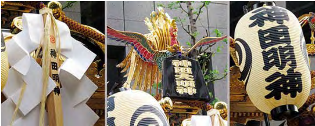
待機中の大神輿の部分をアップで撮影してみました。

それにしても大手町のビル街でも神田明神の大神輿は本当に迫力ありますね。みると、とにかくアマチュアカメラマンの数の多さに驚きますが、年配の男性や女性が本格的な一眼レフのデジタル・カメラに望遠ズームレンズをつけて撮影する姿が目立ちました。