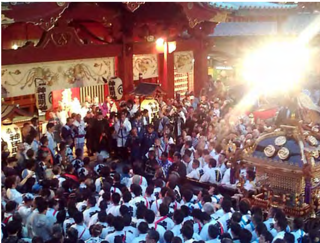
神職を前にいよいよ感動のフィナーレ、大神輿渡御が終了します。