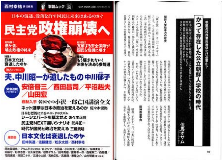
撃議ムック「民主党政権崩壊へ」は定価1200円で オークラ出版から発売中です。(画像クリックでHPへ)