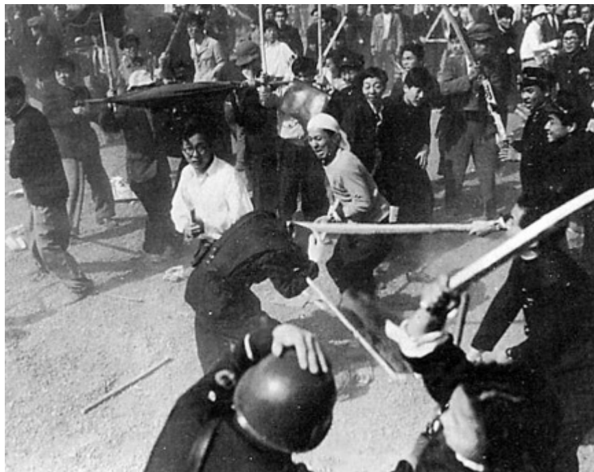
血のメーデー事件、デモ隊と警官隊の衝突

祖防隊(ソバンテ、祖国防衛隊)とは民戦の別動隊で、 日本共産党 の指揮下にある朝鮮人武装集団である。戦後合法政党として再スタートした 日本共産党 が表立ってできない交番襲撃などのテロ行為の一切を引き受けていたのがこの祖防隊だ。