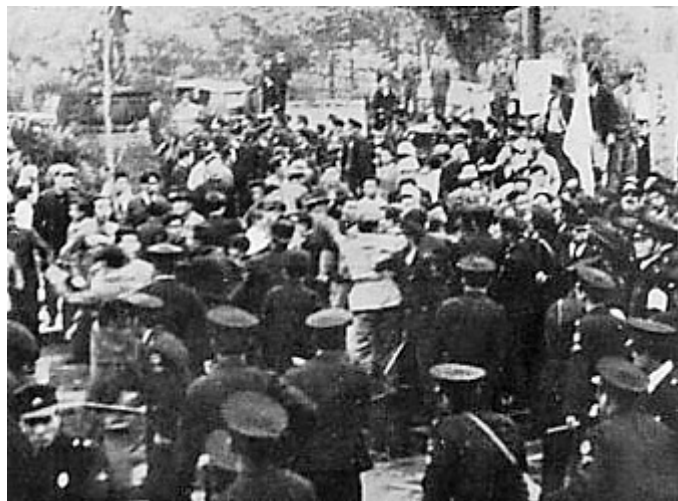
阪神教育事件でデモ隊を鎮圧する大阪市警