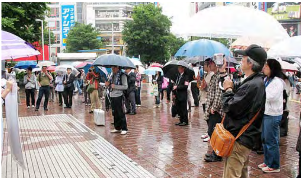
雨の中、90分ちかくずっと聞いていた方も多かったです。