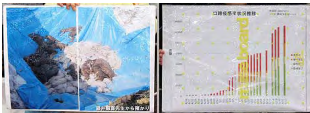
ビニールシートにくるまれて処分される豚と感染数の増加を示したグラフ

それにしても、国家の一大事だというのに政府がモタモタしている現状に、若者が素早くホームページを立ち上げて情報を收拾発信するとともに、街宣もデモも行う、素晴らしい行動力ですね。高く評価し応援していきたいと思います。