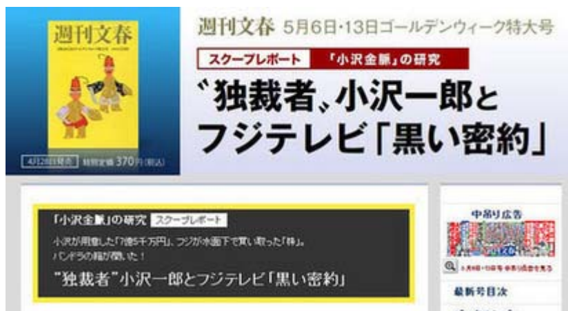
画像をクリックするとこの号の案内ページに飛びます。

私は残念ながらこの号は読んでいませんでしたが、「小沢 フジテレビ 7億5000万円」と入れて グーグル で検索すると、色々出てきます。興味のある方は時間があったらご覧下さい。