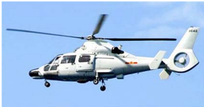
沖縄本島の南方海域で海上自衛隊の護衛艦「あさゆき」に接近した 中国海軍のヘリコプター＝21日午後

このように、 北朝鮮 は 韓国 に対し軍事行動を、支那中共は日本に対して軍事的挑発行動をこの二ヶ月間の間に繰り返してきたのです。一方で、我が日本では安全保障の要である普天間の米軍基地の移転の話ばかりで、間近にあった軍事的危機に対してどのように対応すべきか、政府もマスコミもさっぱり議論が起きていません。