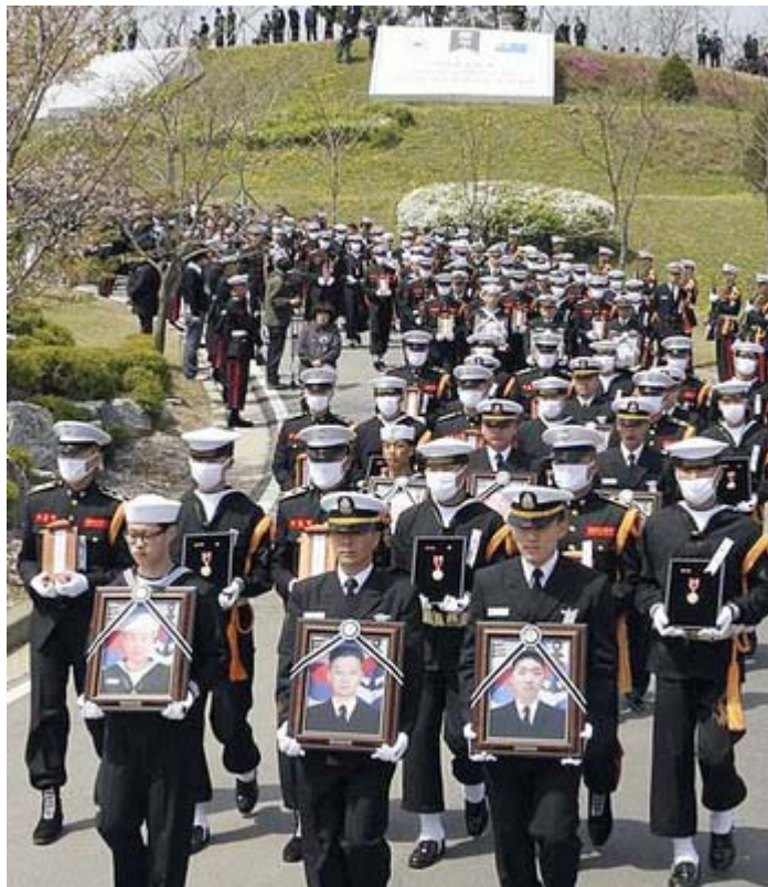
天安艦犠牲者の追悼式4月 (ロイター) 東アジア黙示録さんから