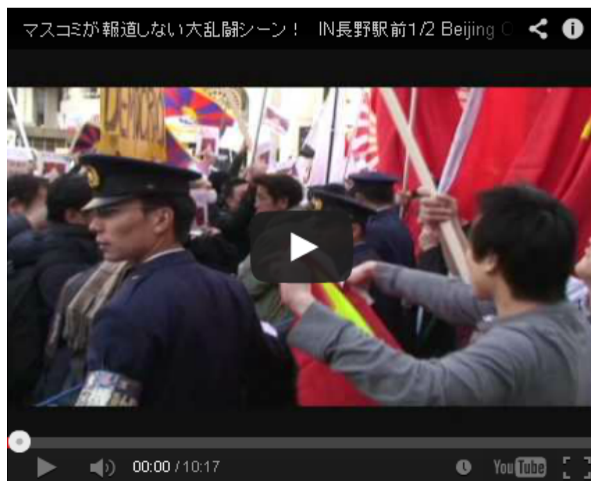
日本人はこの光景を決して忘れてはいけません。

そして偶然でしょうが、この7月1日からは中国の「国防動員法」が施行されます。詳しくは貼り付けた動画を見て頂くとして、イザとなったら中国国内はおろか、海外に滞在する中国人も兵士として本国の命令により動くことを義務づける、まるで戦中を連想させる法律です。そして相次ぐ東シナ海における中国海軍の訓練と挑発行為があります。こうした一連の出来事を結びつけて考えてみると、あるシナリオが連想できると思います。