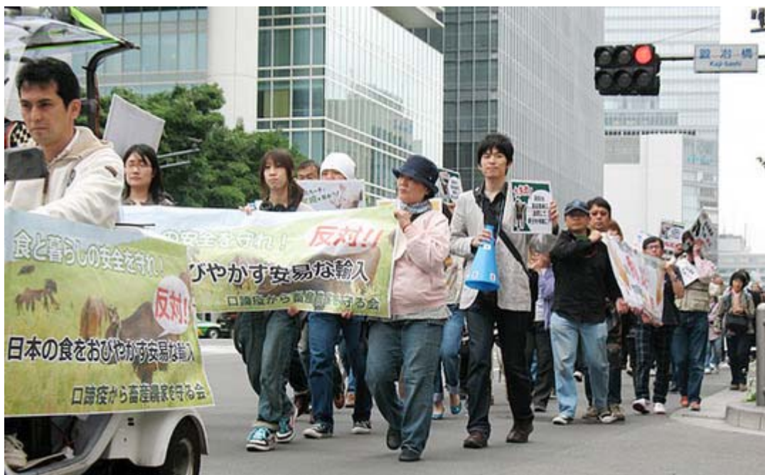
先導者は三輪のスコーターという新兵器、シュプレヒコールも大人しいもので、抗議と言うより訴え、アピールという雰囲気でした。

一方、午後3時からは子ども手当再審議要求デモ@東京の呼びかけによるデモ行進が渋谷周辺で約50人が参加して行われた。既に表参道、横浜と回を重ねており、今回が三回目。一行は神宮通公園を出発して渋谷ハチ公前経由で代々木公園まで、オレンジと黒の統一したカラーによる横断幕、幟などで道ゆく人にアピールしていた。