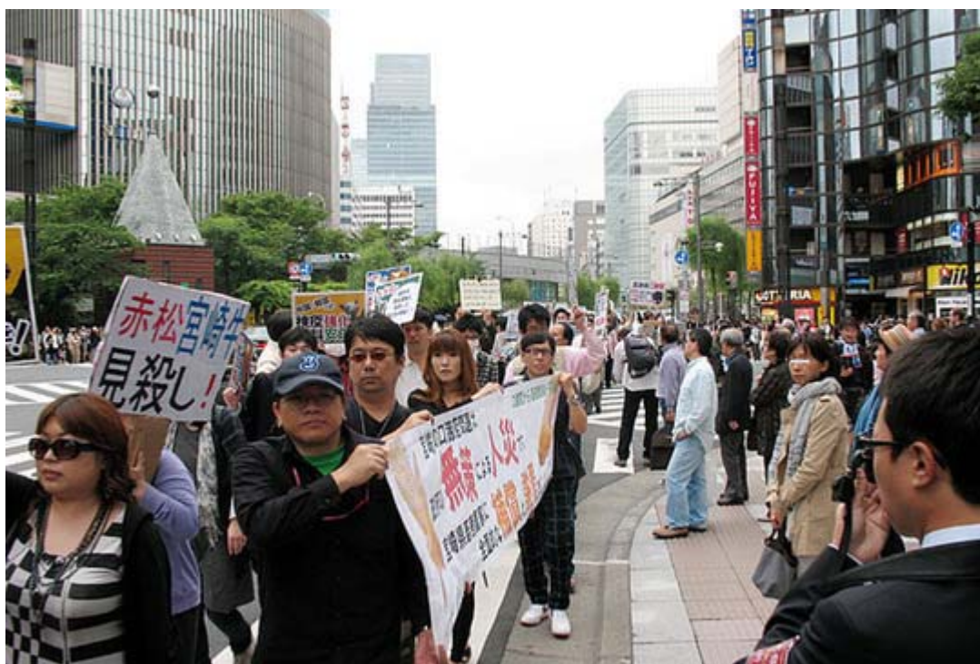
数寄屋橋ソニービル前を通過するデモ隊。信号待ちの通行人も注目していました。

口蹄疫被害と子ども手当 。一般市民にとって関心の高い二つのテーマに関するデモ行進が土曜日の29日、銀座や渋谷で相次いで実施され、繁華街に繰り出していた多くの市民は横断幕やプラカード、そして受け取ったビラを注視するなど注目を集めた。