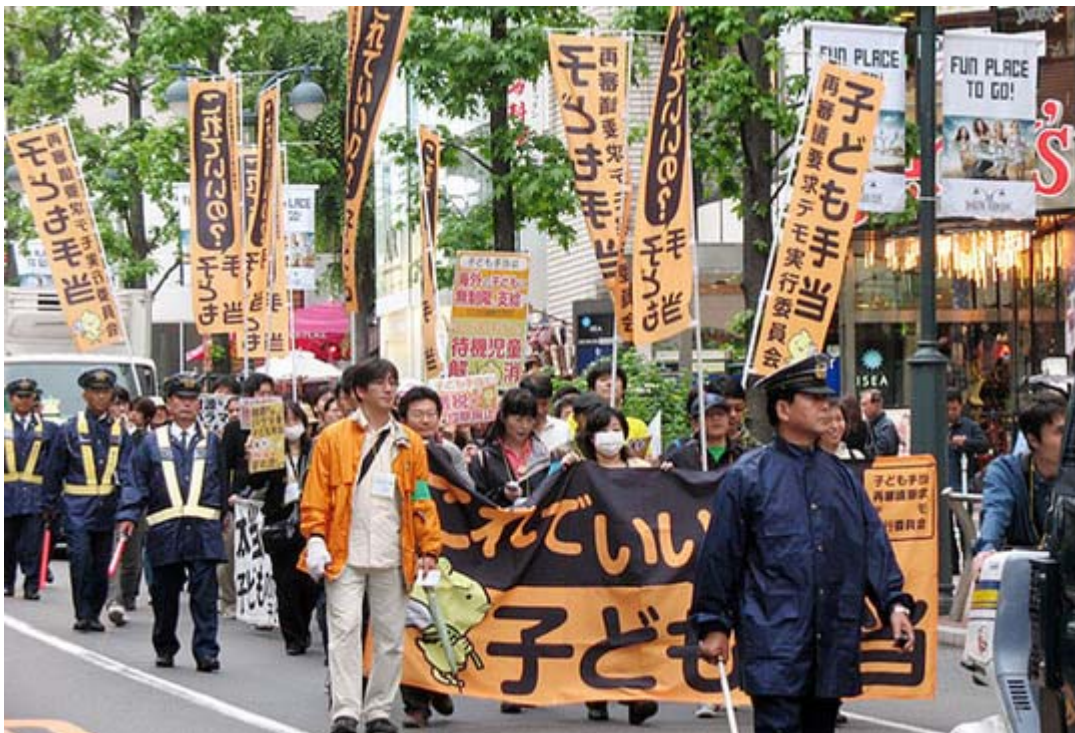
この統一されたオレンジと黒のテーマカラーは目立ちますね。

デモに参加された皆さん、ご苦労さまでした。二つのデモ行進に参加された方も多かったと思いますが、さすがに疲れたと思います。写真を見てもらえば判ると思いますが、この二つのデモ行進は主催者の意向により日章旗はゼロ、最初のデモは旗だけでなく幟もなかったため、ちょっと寂しい印象もうけました。それでも個人が呼びかけて短期間の準備でここまで出来たのですから、成功だったと思います。