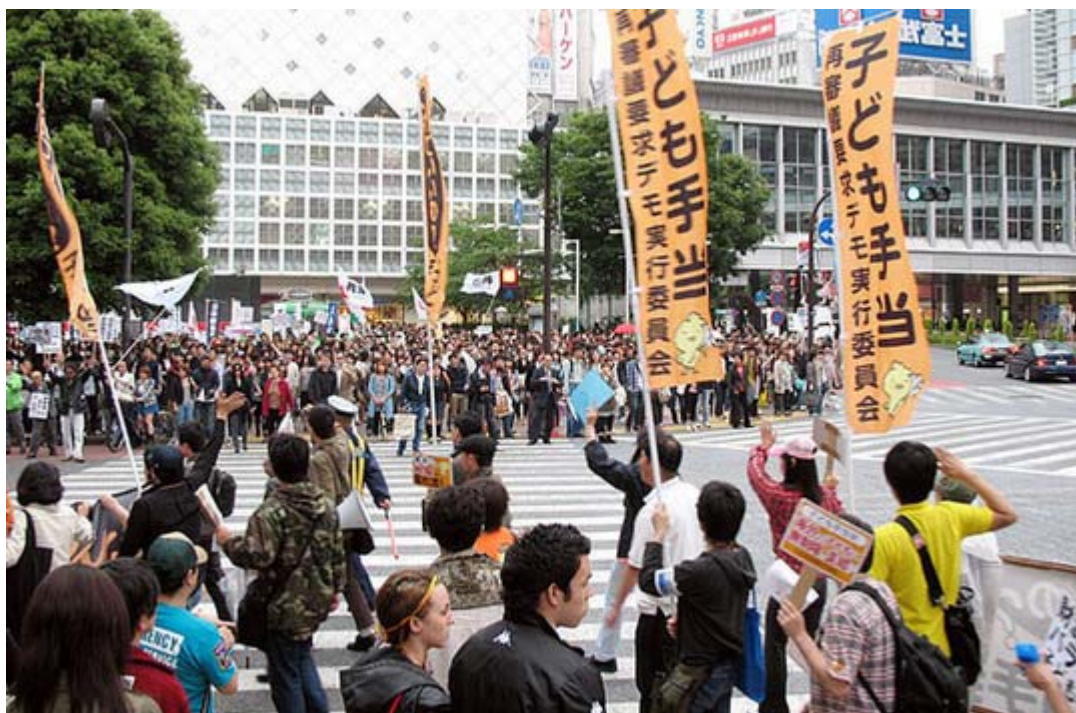
ハチ公前をいくデモ隊。向こうで頑張れ日本！が旗を振ってエールを送ってくれています。

一方、午後3時からは子ども手当再審議要求デモ@東京の呼びかけによるデモ行進が渋谷周辺で約50人が参加して行われた。既に表参道、横浜と回を重ねており、今回が三回目。一行は神宮通公園を出発して渋谷ハチ公前経由で代々木公園まで、オレンジと黒の統一したカラーによる横断幕、幟などで道ゆく人にアピールしていた。