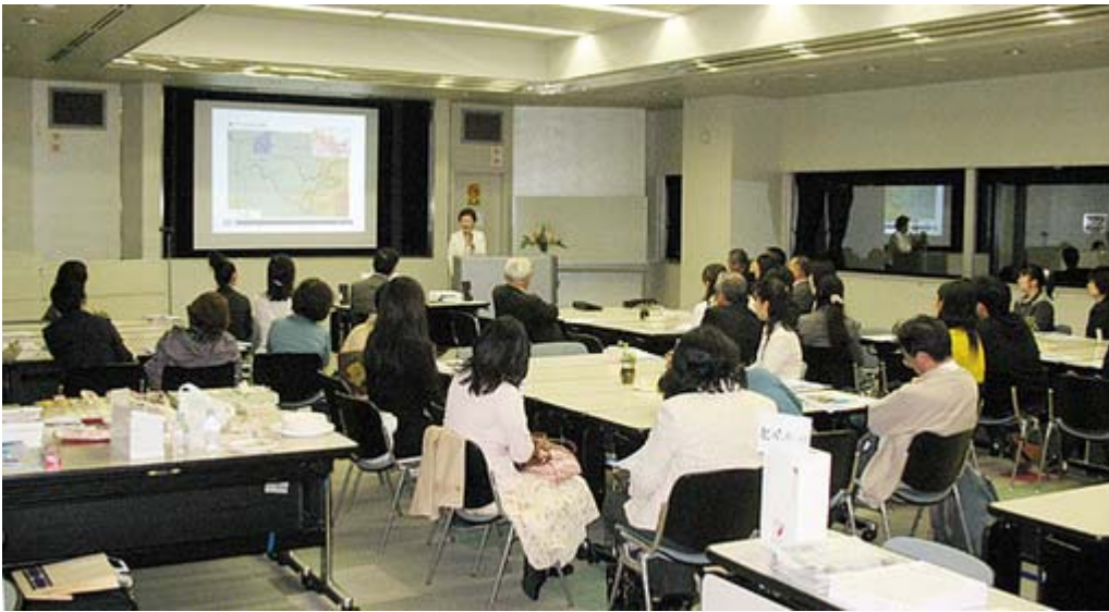
約40人強の女性を中心にした素敵な茶和会でした。