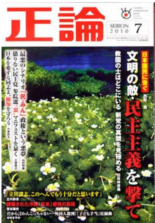
正論7月号は定価740円で好評発売中です (画像クリックで目次ページへ)

それによりますと4月25日に行われた県民大会は主催者発表で9万人と報じられましたが、複数の関係者によると多くて3万人、実際には2万人前後。辺野古地区の住民は以前から現在でも9割以上が移転に賛成、日本一危険な学校といわれた普天間第二小学校は左翼が移転を妨害している、等々、あきれた実情が書かれています。以下、このレポートのごく一部ですが、「さまざまな思惑」と題した文章を抜粋して紹介します。県民は本当のことを言いたくも言えない、恐怖心から誰も告発できない実情を生々しく伝えています。