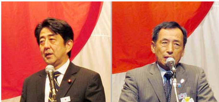
菅直人追求なら 安倍晋三 氏でしょう。田母神閣下の挨拶も気合いが入っていました。

珍しくNHKが取材にきており、夜11時過ぎに全国ネットで放送したそうです(NHKのHPで記事テキストが確認できます)。また今回は本日集会とデモを行う 家族会 、 救う会 、 特定失踪者問題調査会 の三氏が登壇、「是非集会とデモに参加を！」と訴えていました。またやまと新聞の 口蹄疫 特集号外が会場入り口で参加者に配布されていました(日心会の皆さんが配布していました)が、ご苦労様でした。以下、登壇した弁士のリスト、及び緊急共同宣言を掲載しました。