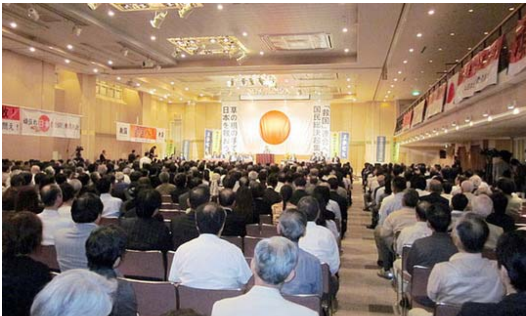
はじまったばかりの全景です。間もなく全席が一杯、平日なのに良く集まってくれました。

参加された皆さん、お疲れ様でした。凄い熱気でしたね。特に前列に陣取った地方議員の皆さんが弁士のスピーチに積極的にヤジ(好意的な)を飛ばしていたので、この熱気をそのままデモ行進に移れたらと思ったほど気合いの入った集会となりました。後世、保守政権が誕生したらこの集会が大きなきっかけとなったといわれると思います。