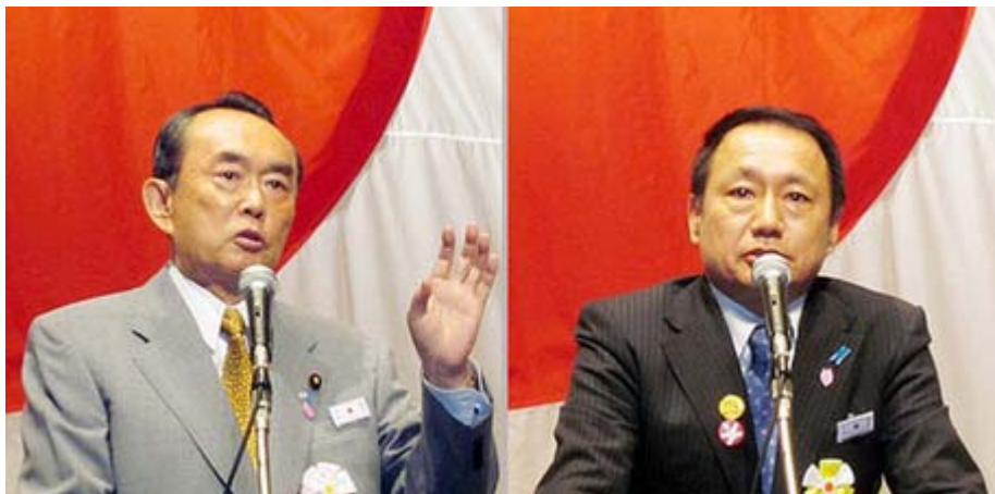
本当に国士を思わせた平沼赇夫氏と抜群のスピーチで会場を湧かせた山田宏氏。