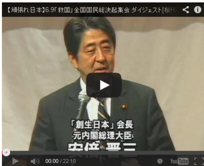
チャンネル桜のダイジェスト版が放映されました。

その結果、子供じみた理想論やヒューマニズムで国民を欺くことなく、現実に今起こっている国内外の厳しい状況を正直に国民に情報開示し、私たちの生まれ育った緑と水と光に満ちた日本、その国土に住む私たち日本国民としての誇りと自立心、優し