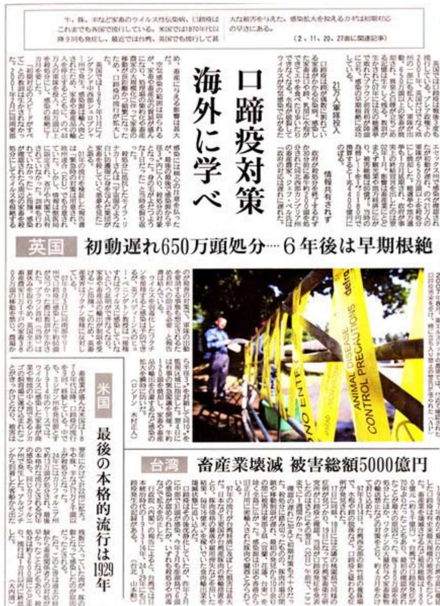
産経新聞5月27日8面に掲載された特集記事。実に良くまとまっています (画像クリックでネット記事へ)

常識で考えて、人も車も移動を制限し、一部では道路閉鎖までしている現状で、 参議院 選のために宣伝カーが感染地帯に走り回ったら、どういう事になるのか？。選挙活動がウイルスをまき散らすという「最悪の事態」すら予想される状況です。 参議院 選挙と 口蹄疫 感染阻止、どちらが日本のために緊急を要するのか、メディアはいまこそ「選挙より 口蹄疫 対策が先決、安全宣言ができるまで延期せよ！」と主張すべきでしょう。