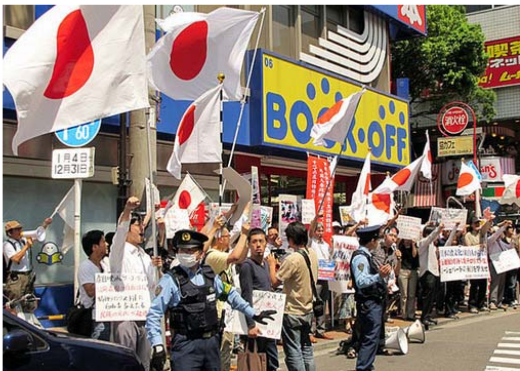
映画館に向かってシュプレヒコールが繰り返された。

映画『 ザ・コーヴ 』の上映中止が相次ぐ中で、予定通り上映を計画している 横浜 ニューテアトル（伊勢佐木町）に対する抗議活動が12日、主権回復を目指す会ほかの主催で実施された。抗議は約40分にわたりシュプレヒコールを交えながら行われ、最後に同館側に抗議文を手渡して 解散 した。（詳しくは新・極右評論 http://blog.livedoor.jp/samuraiai/i/ さんへ）