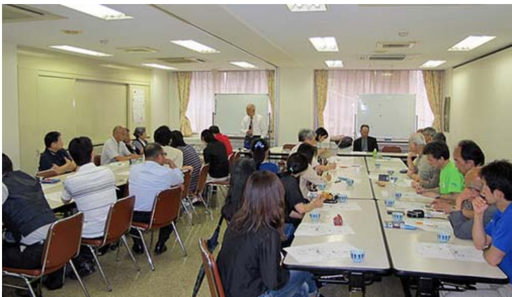
九段の僱行社で行われた第七回祖父まご会の会場スナップ

一方的に話す講演の時よりも、質問に答える形で話すときが思わず本音というか面白い話が聞けるもので、私が「八路軍と国民党ではどちらが士気が上だったと思うか？」と質問すると、「私は八路軍の方が士気が高かったと思う」と次のような話をしてくれました。