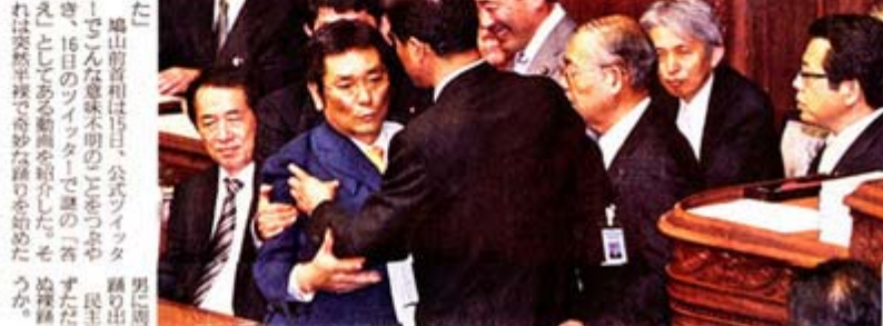
産経新聞一面の画像、左の「沖縄は独立した方がいい」は6月16日付け、右の「論戦なく力づく」は6月17日付け(合成画像、クリックでネット記事)

菅首相は、この美しい島を... 野田内閣... 菅首相は16日の民主党参議院議員総会... 「菅首相は、この美しい島を...」 「菅首相は、この美しい島を...」