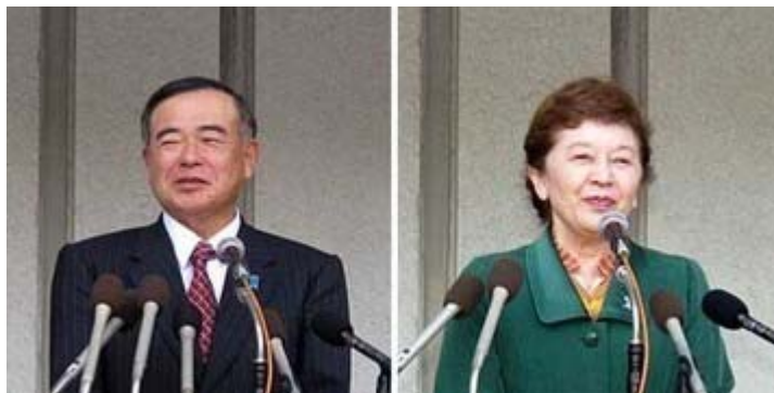
たちあがれ日本に入党する中山成彬・恭子夫妻