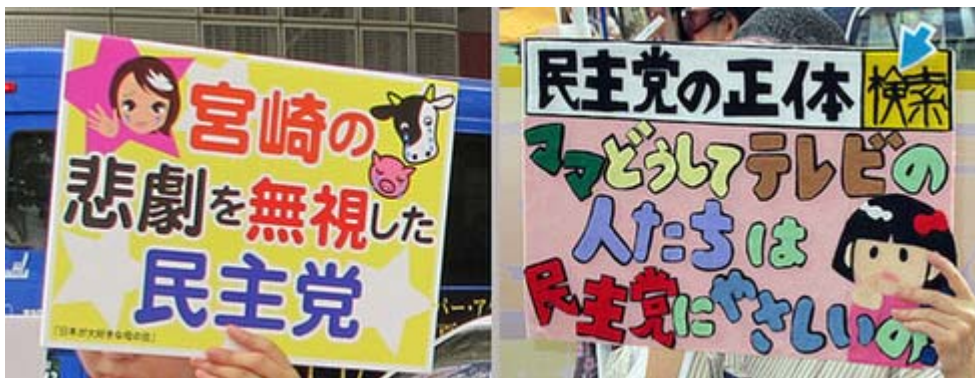
プラカードの数々。口蹄疫問題も取り上げていました。手作りのプラカードは制作が大変でしょうが、気持ちがかもっていいですね

前回は感じたことですが、このデモの主催者の大型横断幕ほどの政治団体のそれよりも見事な出来。また参加者が掲げるプラカードも手作りあり、今の出来事をうまく取り入れたタイムリーなものも多く、本当に感心します。ネットで川柳を募集して読み上げる、というのも新しい試みだと思います。