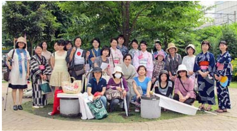
出発前の記念撮影。ゆかた姿の多さが目立ちます。 愛国女性はみな素敵だと思います。