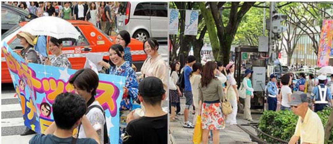
参加者の皆さんの笑顔が素敵でした。デモ隊を「何だろう？」と注目する沿道の人々。

とはいえ、ゆかた姿も多い素敵な女性の団体が、 民主党 政権クーリング・オフを訴えたのですから、沿道の注目度は抜群でした。出来ればこのニュースをチャンネル桜や有志の動画で終わらせることなく、メディアへの拡散に努力しより多くの人にとって欲しいと思います。はじめてデモに参加されたお母さん、ご苦労さまでした。この輪が広がれば日本は変わると信じて今後も頑張っ