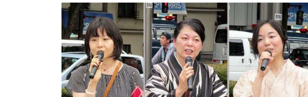
デモ行進を終えて挨拶する協賛団体の方々。左から神楽花、愛国女性のつどい花時計、 子ども手当 再審議要求デモ実行委員会の代表。

て欲しいと思います。 以下、先導車とデモ隊が沿道の方々にアピールした数々の訴えのなかから、宮崎の 口蹄疫 問題についての部分を紹介しま