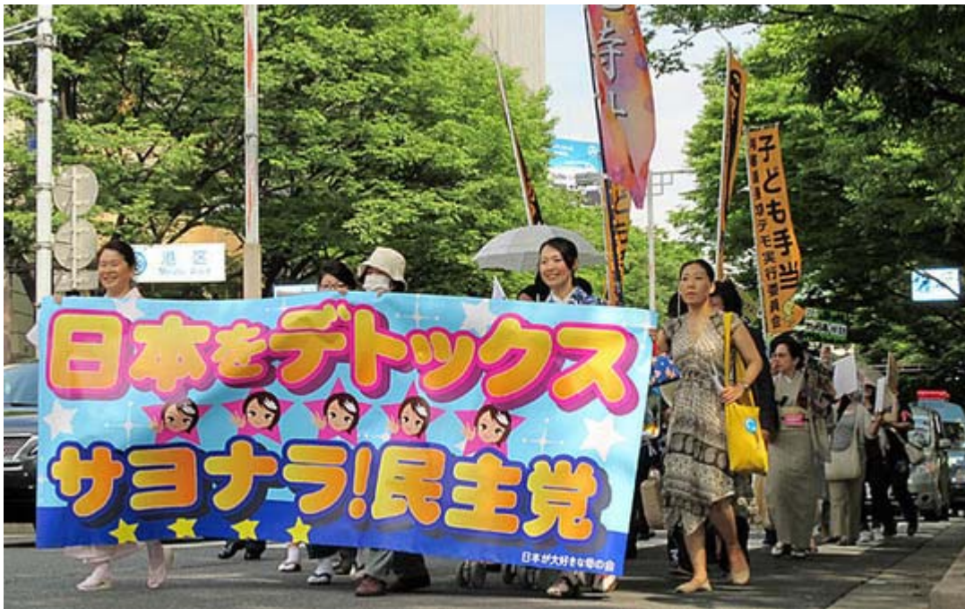
表参道を原宿方面に向かうデモ隊。この付近が沿道の人出が一番多く、抜群の注目を集めていた。

参加された皆さん、応援に駆けつけた男性の皆さん、暑かったですね、本当にお疲れ様でした。出発して間もなく、渋谷ハチ公前で街宣活動をしていた「頑張れ日本！全国行動委員会」と道路を挟んで エール を交換していました。私はこのシーンを撮影するのは二回目ですが、嬉しい、よい光景だと思います。