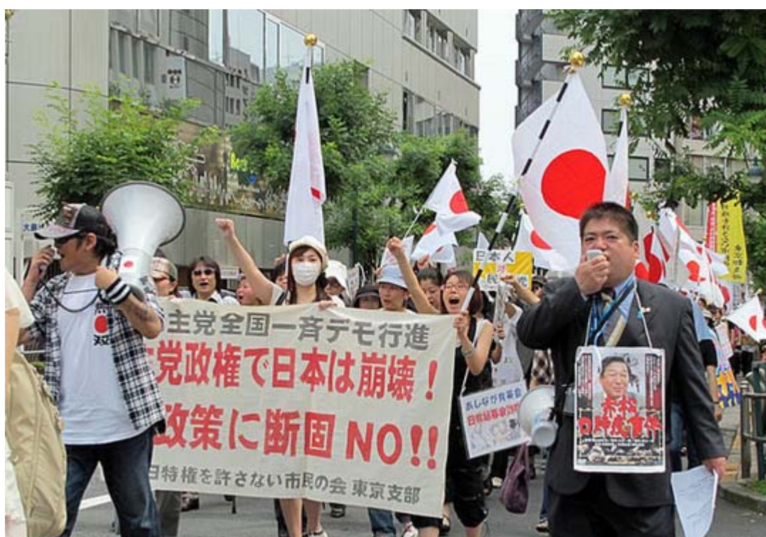
先頭の横断幕を持つのは女性陣、コーラーも女性と優しい在特会を演出か？

この一斉デモはすべてニコニコ動画による生中継が行われ、生放送を見たのは全国で12,160人、寄せられたコメント数は16,996に上った。同会は行動する保守のなかでも会員数が9000人を超す飛び抜けた存在で、保守系団体が単独で全国10都市で同時デモを行ったのはこれがはじめて。(ニュース調こまで)