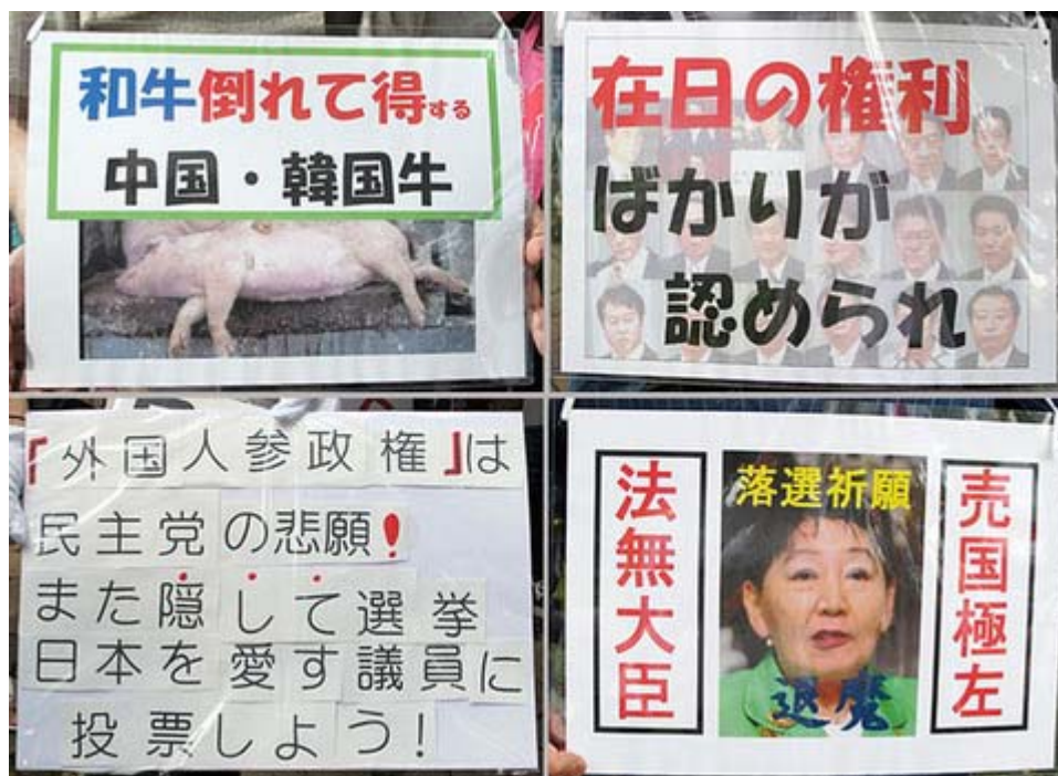
参加者が首にかけていたプラカードから四タイプを撮影

私はカメラ撮影の関係で普段は小振りのZ旗を持参して参加して参りましたが、今回は公示前の事実上の最後の機会になるだろうと考え、レギュラーサイズのZ旗を持参、撮影もデモ行進の前半で切り上げ、後はデモに参加してシュプレヒコールを繰り返してきました。下の写真のZ旗がそれで、日章旗と旭日旗と組み合わせて撮影するために、参加者の一人にお願いして持って頂いた次第です。ご協力ありがとうございました。