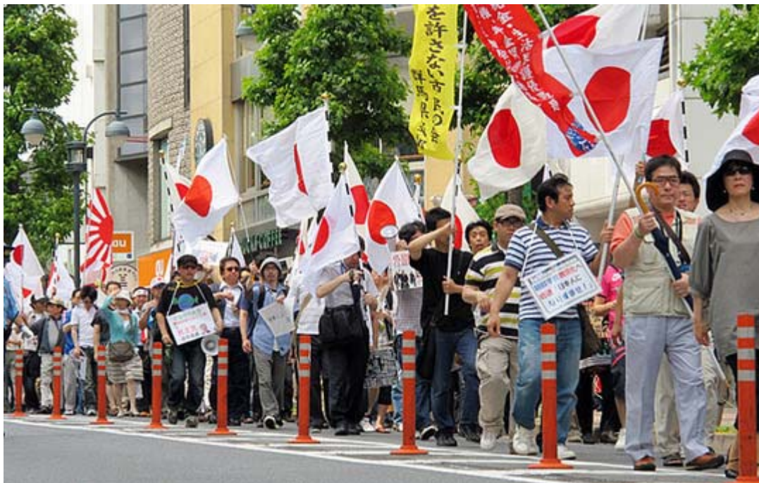
シュプレヒコールの大声、気合いの入りは渋谷の街にこたまし迫力がありません。

私はカメラ撮影の関係で普段は小振りのZ旗を持参して参加して参りましたが、今回は公示前の事実上の最後の機会になるだろうと考え、レギュラーサイズのZ旗を持参、撮影もデモ行進の前半で切り上げ、後はデモに参加してシュプレヒコールを繰り返してきました。下の写真のZ旗がそれで、日章旗と旭日旗と組み合わせて撮影するために、参加者の一人にお願いして持って頂いた次第です。ご協力ありがとうございました。