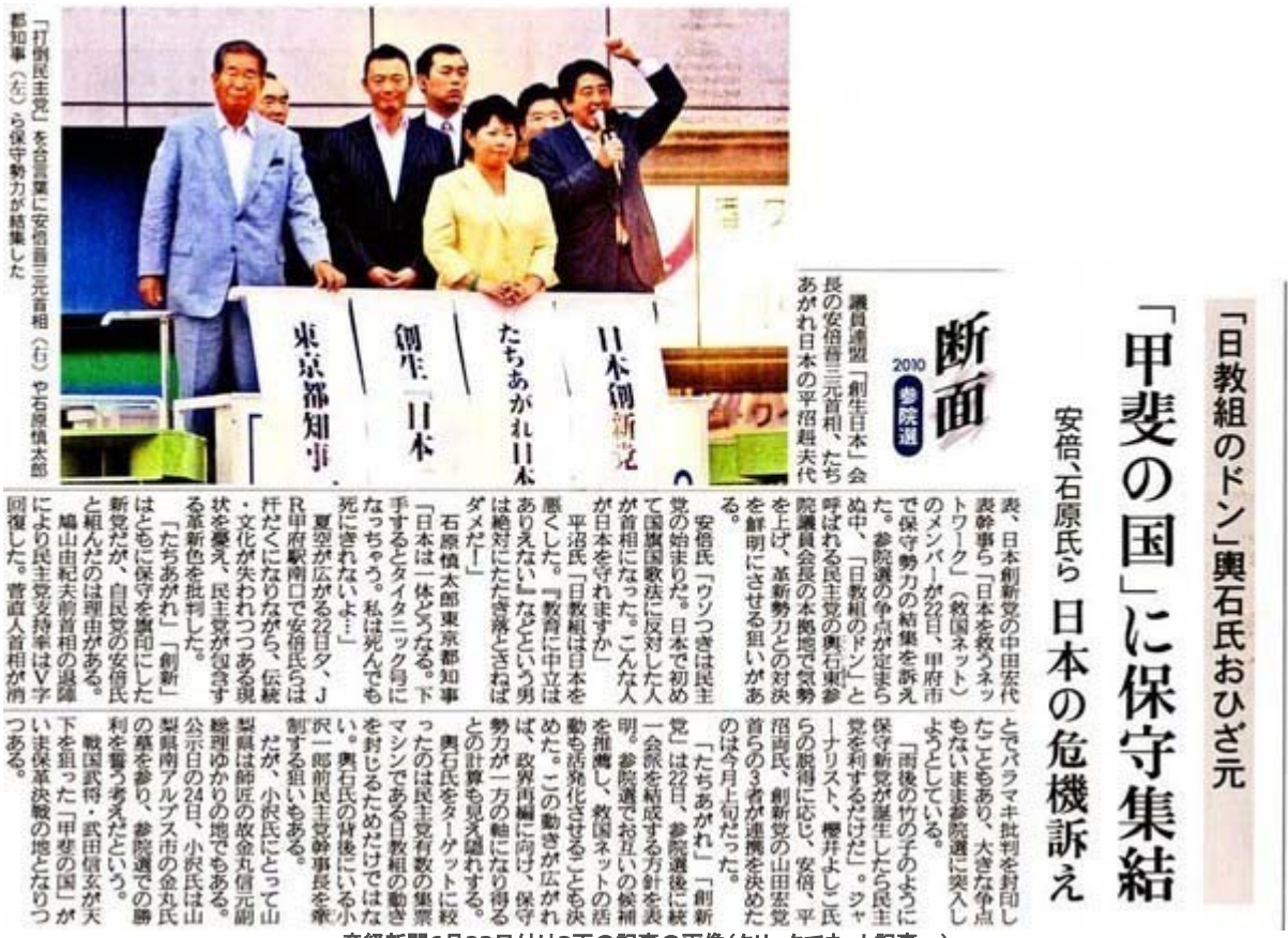
産経新聞6月23日付け3面の記事の画像(クリックでネット記事へ)

記事で紹介された安倍氏と平沼氏の発言内容を読んで下さい。「ウソつきは民主党のはじまり」「日教組は日本を悪くした」。そうそう、私達は残念ながら少数派の野党なんですから、多数派の悪の帝国「反日軍」に対抗するためには「戦う姿勢」を強調しないといけません。まずは産経新聞の記事と画像をご覧ください。