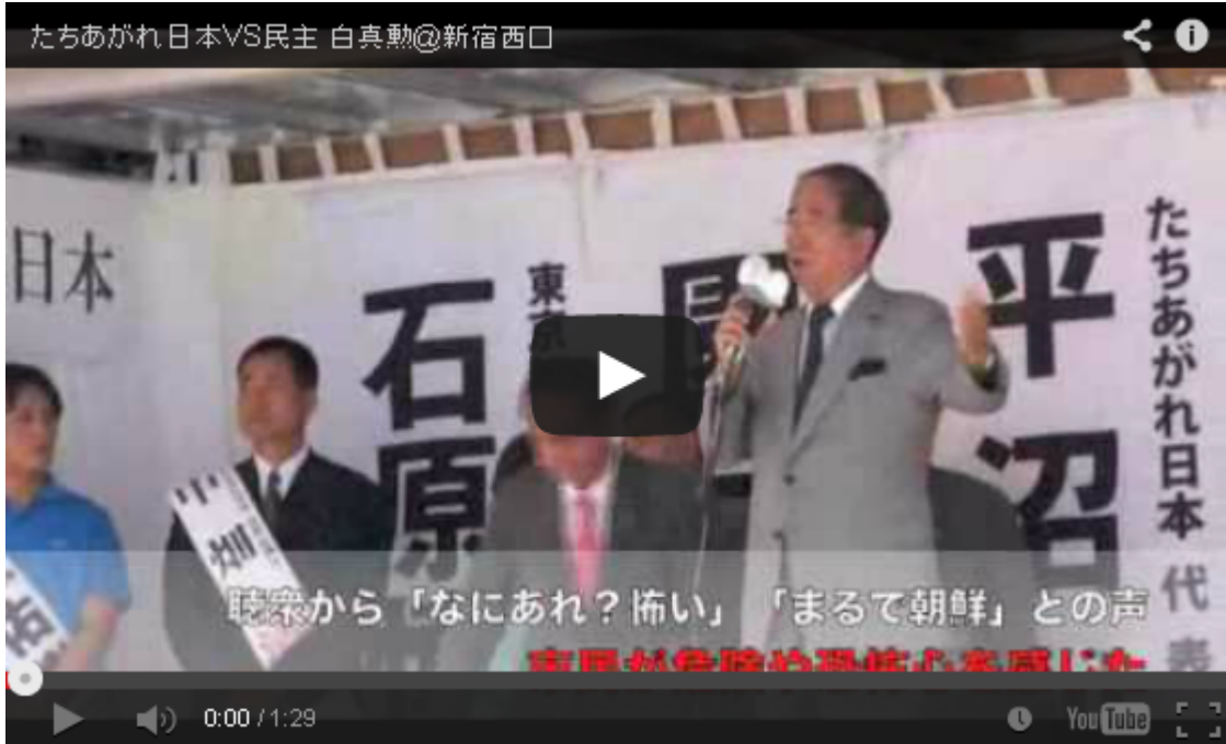
石原都知事の注目の発言。やまと新聞社さんの動画です。