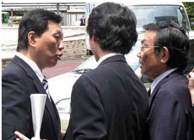
たちあがれの与謝野馨共同代表(71)が民主党・末松義規衆院議員(53)に胸ぐらをつかまれるなど、激しい口論に発展した。

国民として正しい行動をすべきであり、不正や疑わしいと思われる候補者を見つけたらすぐにその場の警察官に申し出て、その結果を知らせてもらうことです。携帯電話で撮影しておくのも良い方法です。その場で告発するのがためらわれるようでしたら、後日でもかまいません積極的に管轄の選挙管理委員会や警察に届けましょう。この国民一人一人の行動が正しい選挙につながります。