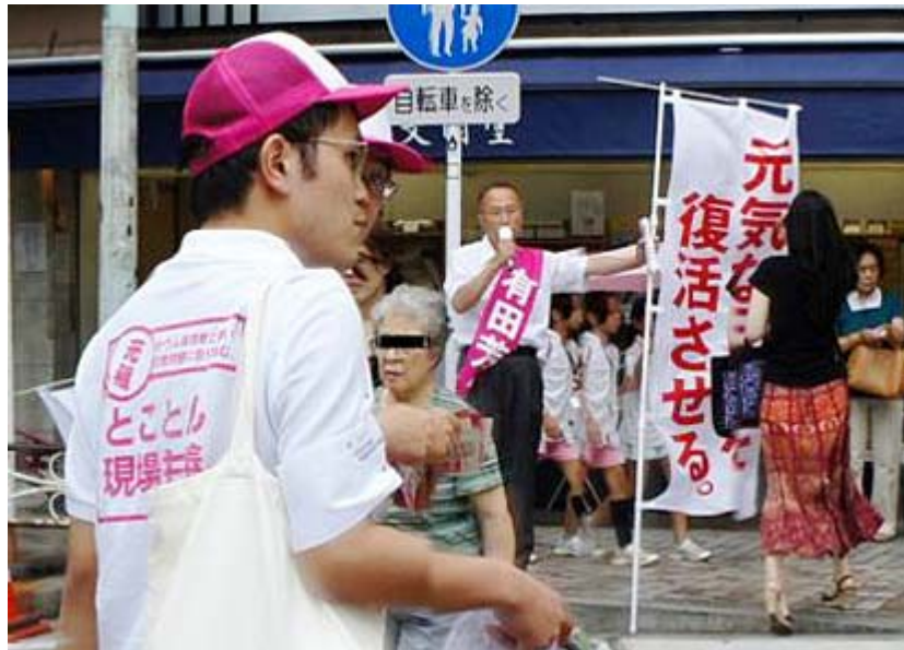
有田芳生「は？やまと新聞か、そんなもん新聞じゃねーよ」 「おい。ちょっとこい」

私たちはこれはおかしいと思ったらかならず警察に届け出ます。一人でも多くの方が同じような行動をしてくれたなら公正な選挙になると思いませんか？有権者の目が光れば政党や候補者もルールを守った選挙運動をするようになるはず。その上で不便や不合理があれば次の選挙前に公職選挙法を改正すれば良いのです。