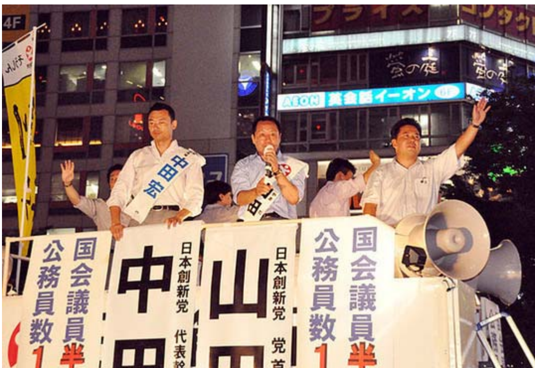
日本創新党の一番と二番が揃った渋谷での街頭演説会スナップ。

また政策的な話しも、自ら 横浜市 長の時代に財政を立て直した具体策を訴え、「今の政府には出来ないだろうから教えてあげろ」という調子です。大学の教室で先生が生徒に講義しているような錯覚すら覚えます。政策的な話は「ごもつと」なのですが、繁華街にはいろいろな騒音に囲まれていて、短い時間でもっとも訴えたい事を効率よく叫ばねばなりませんから、空回りしている感は否めません。