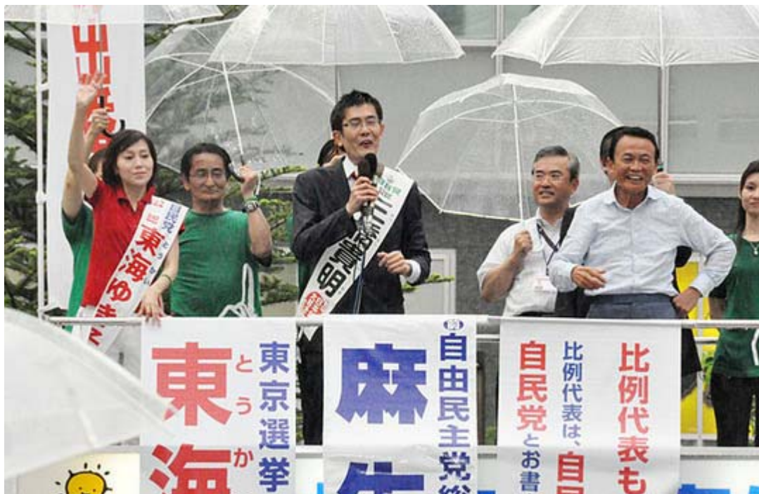
麻生元総理の人気を伺わせた秋葉原での自民党の街頭宣伝。 明るく元気でムードは非常によいです。

一方、19時から渋谷ハチ公前で行われた日本創新党の街頭宣伝は、比例の中田宏、東京選挙区の山田宏とナンバー1と2が揃い踏み、「二人の宏」への支持を訴えた。中田氏は横浜市長時代、山田氏は杉並区長時代の財政再建の実績をアピール、「このままでは数年で日本の財政は破綻するが、私達に任せて貰えば必ず再建できる」とアピールしていた(ニュース調こまこま)。